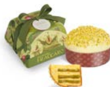
Panettone con Crema al Pistacchio Linea Incarto Artigianale