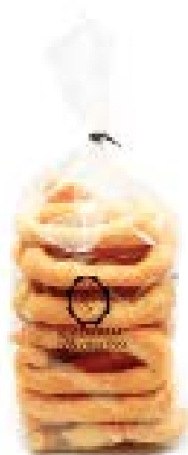
Scaldatelli di grano duro