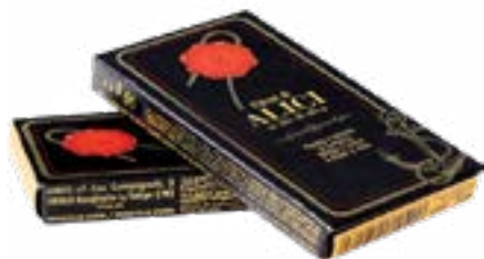
Alici del Mar Cantabrico 50 g