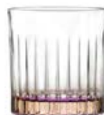
Bicchieri "Gipsy" Orange