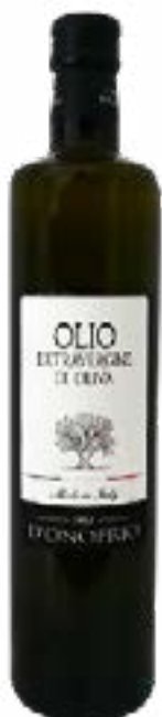
Olio Extravergine di Oliva Fratelli D'Onofrio