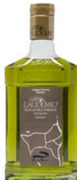
Olio "Laudemio" Casa di Monte