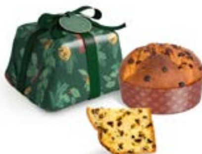
Pandolce Vegano con gocce di cioccolato Linea Incarto Artigianale Luxury Line