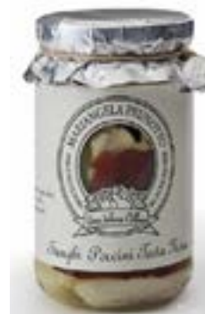
Funghi Porcini testa nera