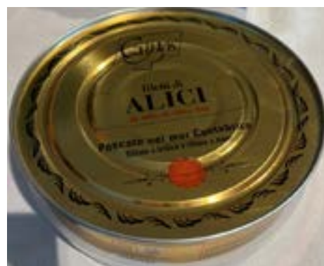
Filetti di Alici Tamburello