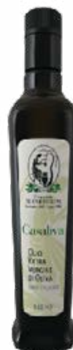
Olio Extra Vergine di Oliva Monocultivar CASALIVA