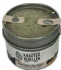
Sale aromatico per Carne