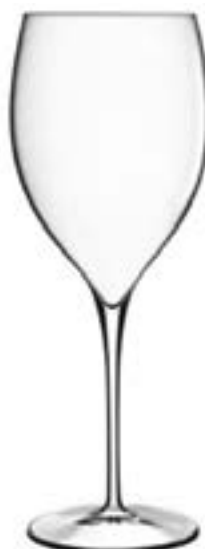
Calice Magnifico XL