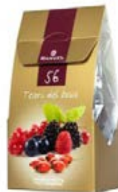
Tesori del Bosco