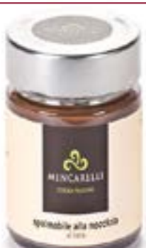
Crema spalmabile Nocciola Latte