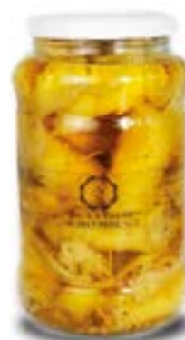
Involtoini di melanzane, pomodori secchi e tonno