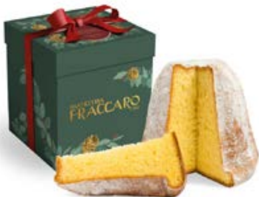
Pandoro Classico Linea Confezione Regalo Luxury Line (astuccio alto)