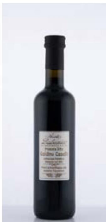
Aceto Balsamico MO IGP 0.50 l Caselli