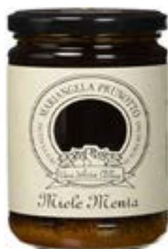
Miele di Menta