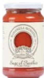
Sugo al Basilico