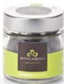
Bassinato Pistacchio Barattolo