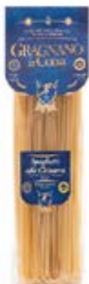
Spaghetti alla chitarra