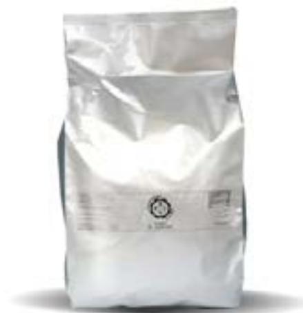
Chips di verdure