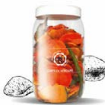
Chips di verdure disidratate saline