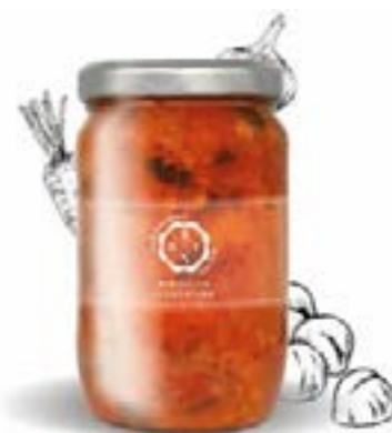
Zuppa Toscana Antica