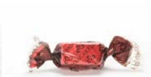
Pralina con ripieno al melograno