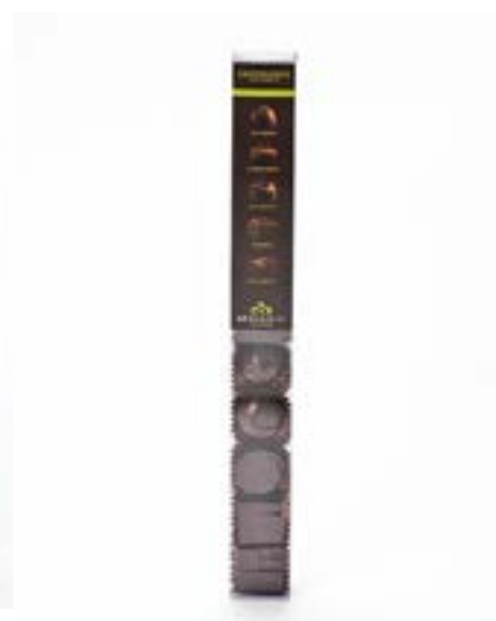
Cioccolosità delle Marche 10 pezzi