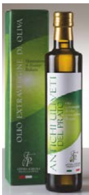
Antichi Uliveti del Prato