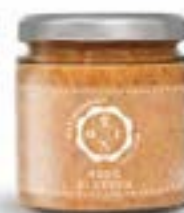
Ragù bianco di cervo