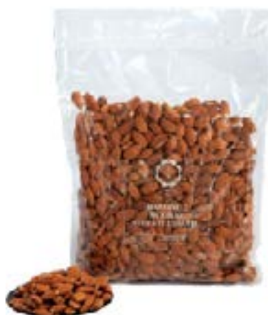
Mandorle tostate salate