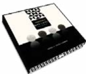
Black & White