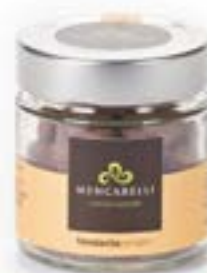
Bassinato Zenzero Barattolo