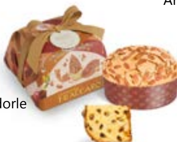
Panettone alle Mandorle Linea Incarto Artigianale