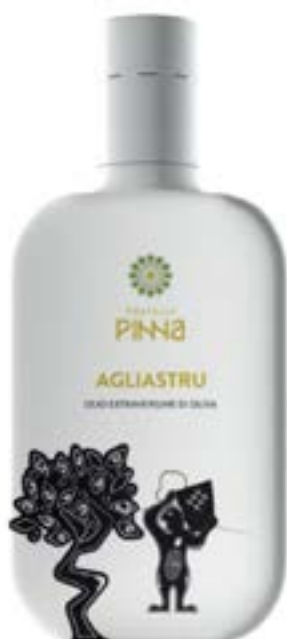
Maccia d'Agliastru bottiglia Luxury