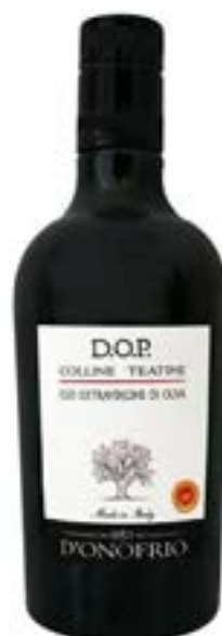
Olio DOP "Colline Teatine" Fratelli D'Onofrio