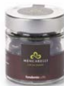
Bassinato Caffè Barattolo