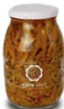
Melanzane a filetti