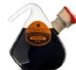
Condimento Supremo 40 ml