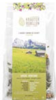
Bustine Piramidali Amore Montano