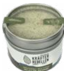
Sale aromatico Mediterraneo