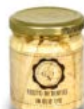
Dentice a filetti in olio oliva