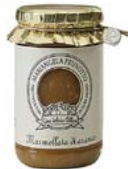
Confettura di Arance