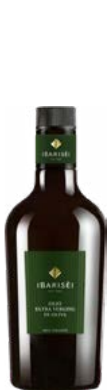
Olio I Barisèi