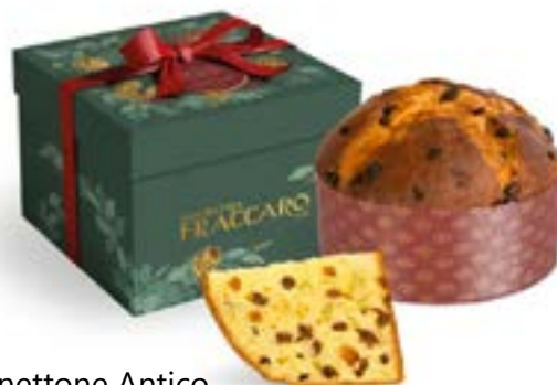
Panettone Antico Linea Confezione Regalo Luxury Line (astuccio basso)