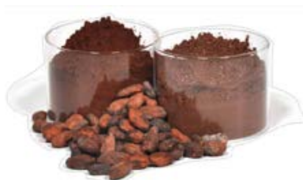
Cacao in polvere e preparato per cioccolato in tazza