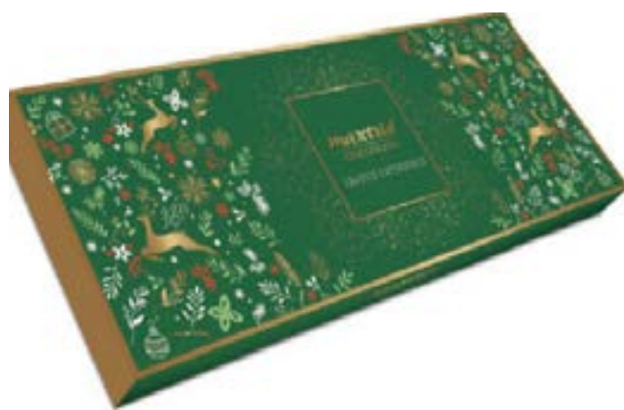
Christmas Truffle Box