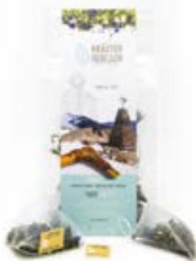
Bustine Piramidali Ghiaccio Eterno