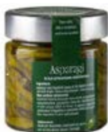
Asparagi in olio