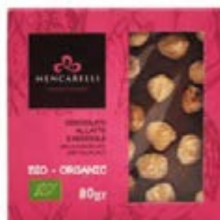
Cioccolato al latte e nocciola BIO