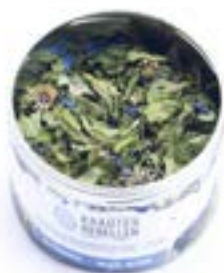
Lattina Menta Alpina