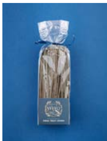
Linguine al Nero di Seppia