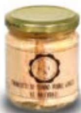
Trancetti di tonno al naturale