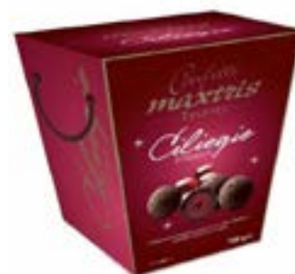
Truffle Bag Ciliegie Fondente