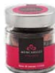
Fave di Cacao Tostate