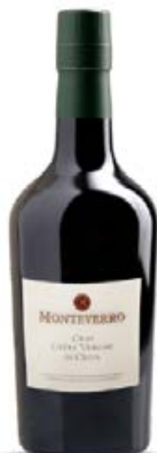
Olio Extra Vergine di Oliva Monteverro