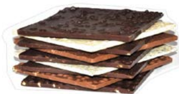
Tavolette con Frutta secca Ho.Re.Ca.