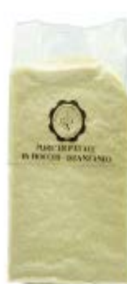
Purè di Patate