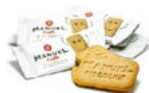
Biscottini Biscookies Caramello