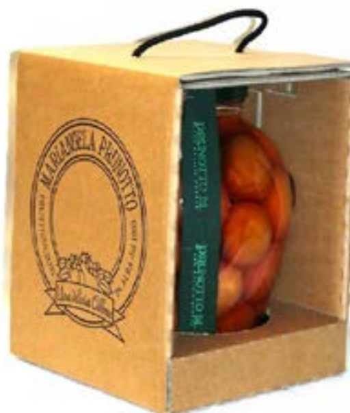
Pesche al Moscato