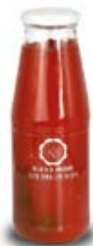
Passata Extra Densa con Basilico