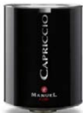
Latta 2 Kg Caffè Capriccio