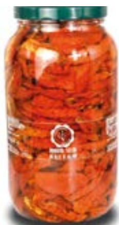
Pomodorini perini essiccati