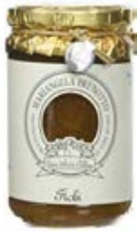
Confettura di Fichi