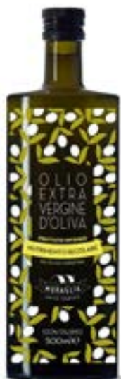
Essenza: Fruttato Intenso