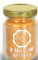
Bottarga di tonno grattugiata