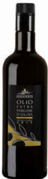
Olio Extra Vergine di Oliva Innocenti