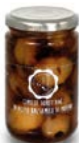
Cipolle borettane aceto balsamico