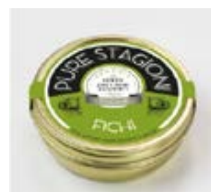
Armonia di Fichi