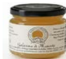
Gelatina al Moscato