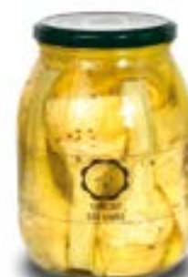
Carciofi con gambo alla Romana