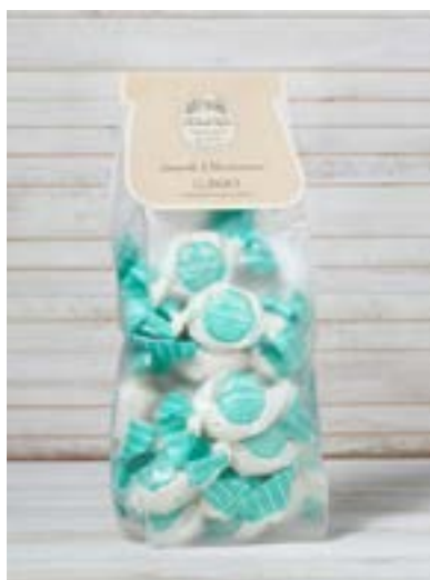
Sacchetto di Amaretti Classici