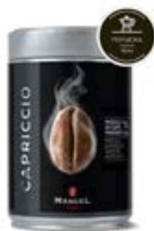
Capriccio Barattolo Macinato