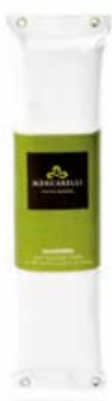
Nocciolato all'olio d'oliva e nocciole