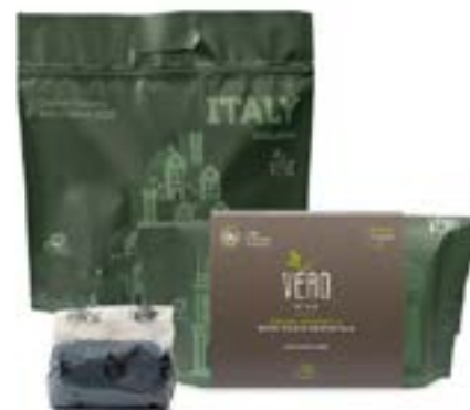
Conf. ECOBAG: Riso Black Integrale