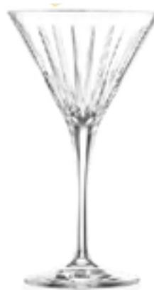
Calice Martini Timeless