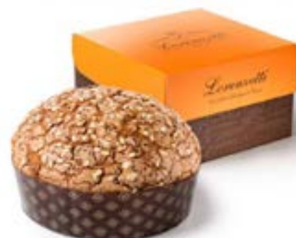
Veneziana alle Albicocche