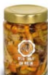
Misto funghi con porcini