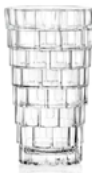
"Stack" HB Tumbler