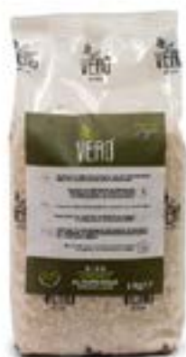
Conf. Regular: Riso Arborio al naturale