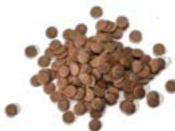
Ciocolato al latte in gocce