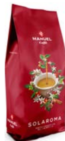
Miscela Caffè "Solaroma"