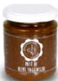
Patè di Olive Taggiasche