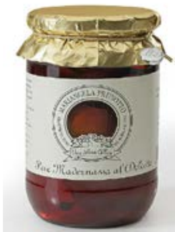
Pere Madernassa al Dolcetto