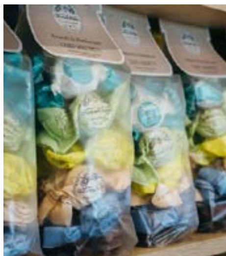
Sacchetti di Amaretti Assortiti