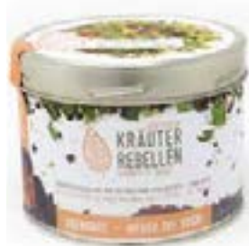
Lattina Infuso Dei Sogni