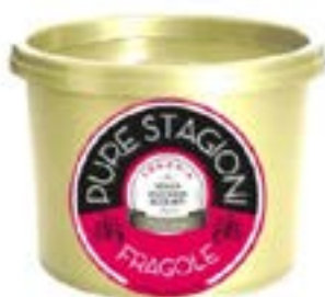
Linea Ho.Re.Ca. Confettura di Fragole