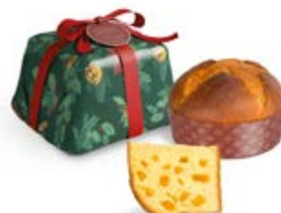
Panettone Zucca e Farina di Mandorle Linea Incarto Artigianale Luxury Line