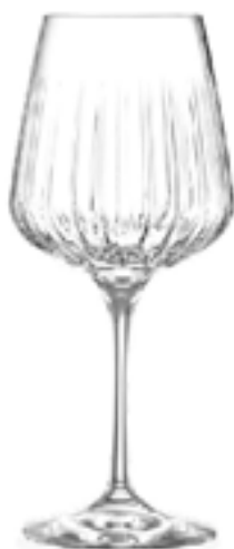
Calice Spritz Timeless