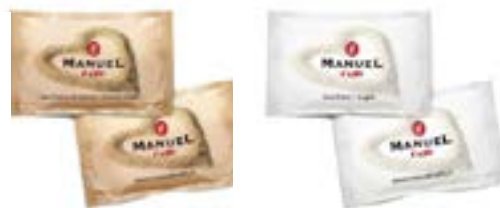
Zucchero in bustine