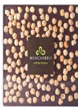
Tavoletta Fondente e Nocciole