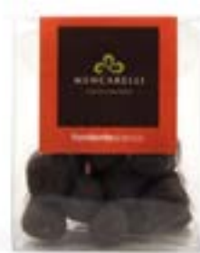
Bassinato Arancio Astuccio