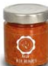
Ragù alla Bolognese