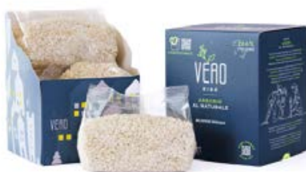
Conf. Natural Cube: Riso Arborio al Naturale