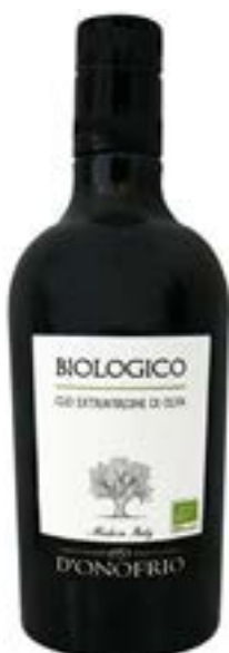
Olio BIO Fratelli D'Onofrio