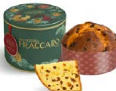
Panettone antico Linea in Latta Luxury Line