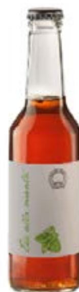
Tè alla menta Infuso di foglie di tè aromatizzato alla menta