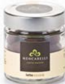
Bassinato Nocciola al latte Barattolo