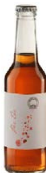
Per Tè Tisana aromatizzata (petali di rosa, papaya e fragola)