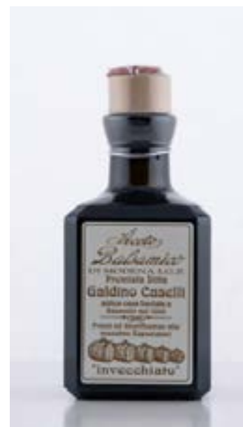
Aceto invecchiato QUADRATA