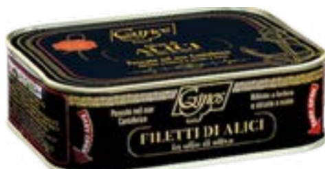
Alici del Mar Cantabrico 320 g