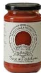
Sugo all' Ortolana