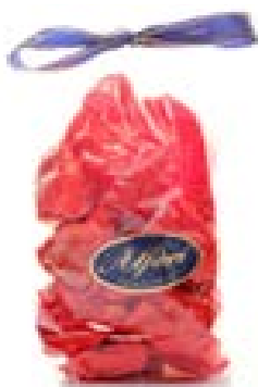
Cuneesi al Ruhm