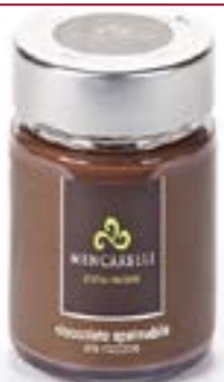
Crema spalmabile Nocciola