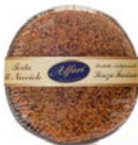
Torta di nocciole senza farina