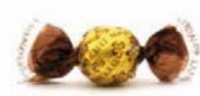
Liquorino al limoncello