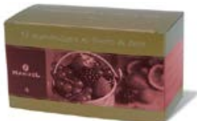
Infuso Frutti di Bosco