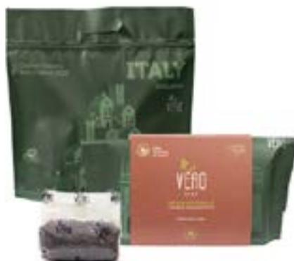
Conf. ECOBAG: Riso Red Integrale