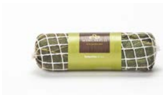
Lonza di Fico Tradizionale