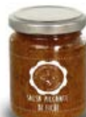
Salsa piccante di fichi