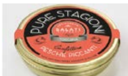
Confettura salata di pesche piccanti