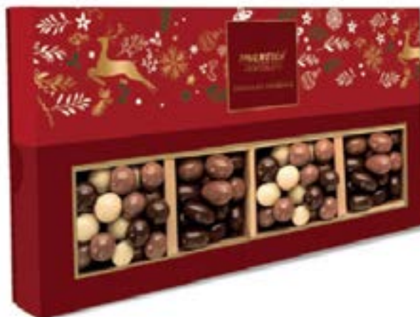
Christmas Chocolate Collection