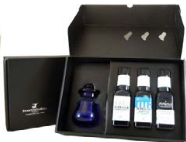
TRIS BOX DECIMINI CON BICCHIERE