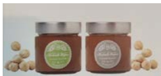
Le paste di Nocciola