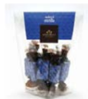
Rombo Pralina mirtillo