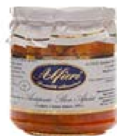
Antipasto bon Appetit