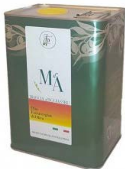
Agliastru Latta 3 Lt