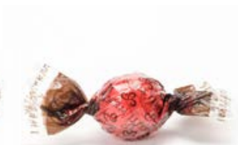
Liquorino alla Visciola