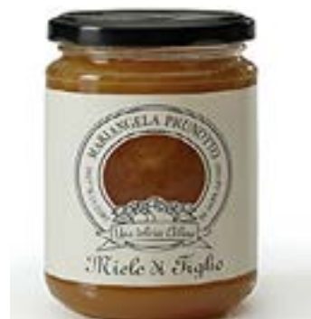
Miele di Tiglio