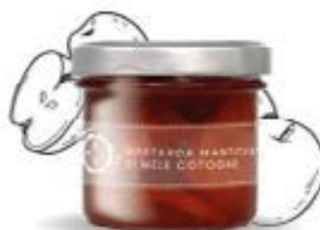
Mostarda Mantovana di mele cotogne