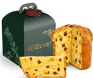
Panettone Classico Linea Astuccio Luxury Line