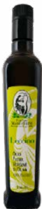
Olio Extra Vergine di Oliva Monocultivar LECCINO