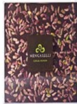
Fondente e Pistacchio