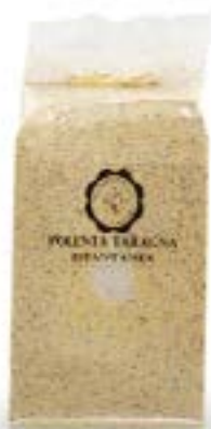
Polenta Taragna istantanea