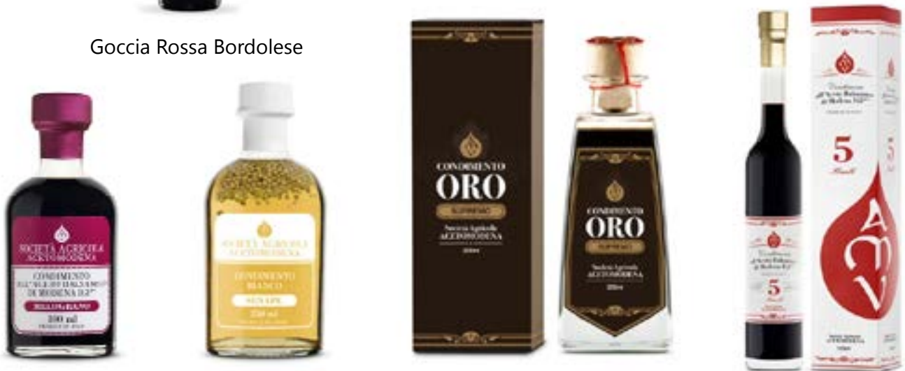
Condimento "Melograno" Condimento Bianco Senape