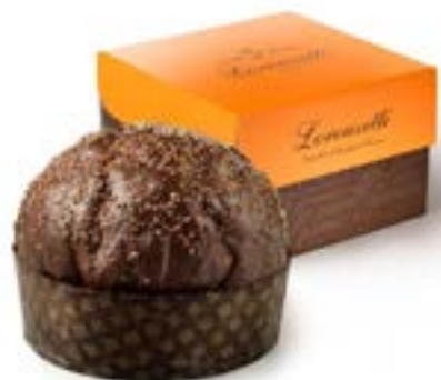
Veneziana alla Gianduia