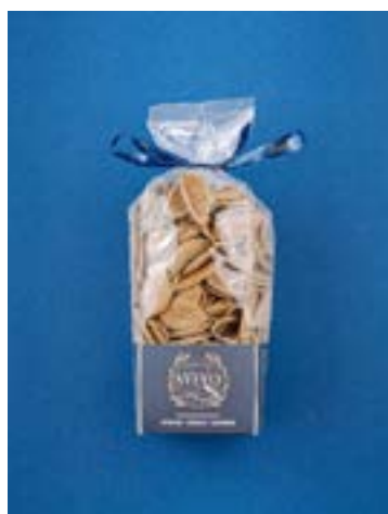
Strascinate al grano arso