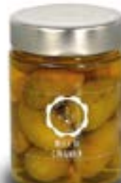
Belle di Cerignola calibro 3G