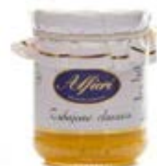
Zabaione Classico Marsala