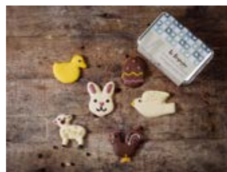
Formine di Pasqua