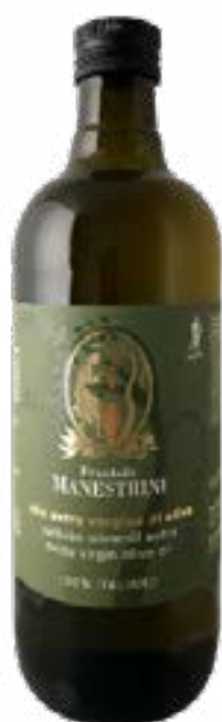
Olio Extra Vergine di Oliva 100% Italiano