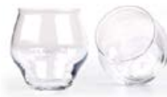
Bicchieri Degustazione Nannoni