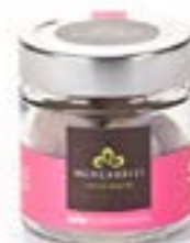
Bassinato alla Noce Macadamia