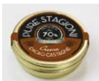
Crema di Cacao e Castagne