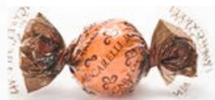
Liquorino alla Moretta di Fano