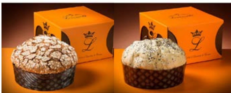
Veneziana al Recioto