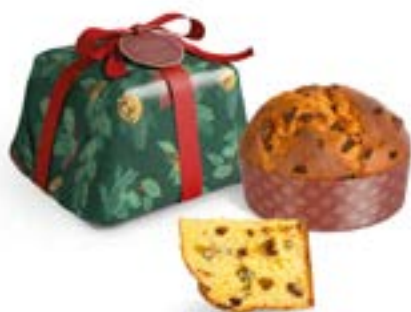
Panettone Nocciola e Cioccolato Linea Incarto Artigianale Luxury Line