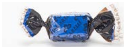
Pralina con ripieno al mirtillo