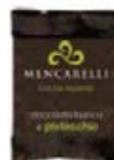
Napolitans cioccolato bianco e pistacchio