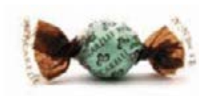
Liquorino all' Anice