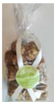
Brutti ma Buoni