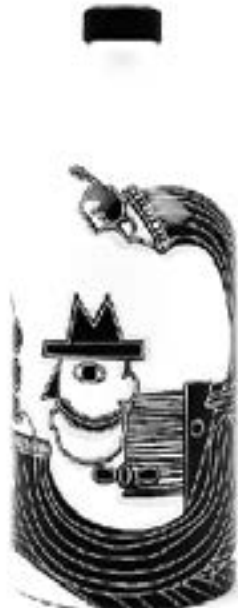
Uomo col cappello