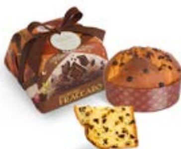
Panettone al Cioccolato Linea Incarto Artigianale