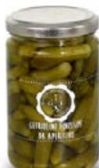
Cetriolini Finissimi Aperitivo