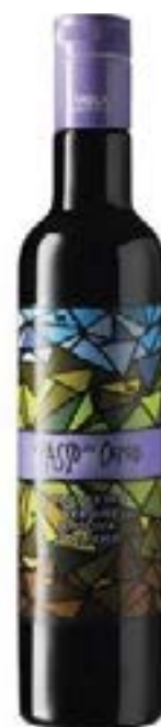
Olio Evo "Il Passo delle Capre"