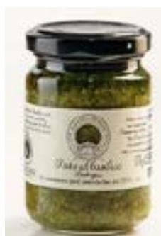
Pesto al Basilico