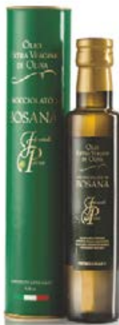
Denocciolato di Bosana