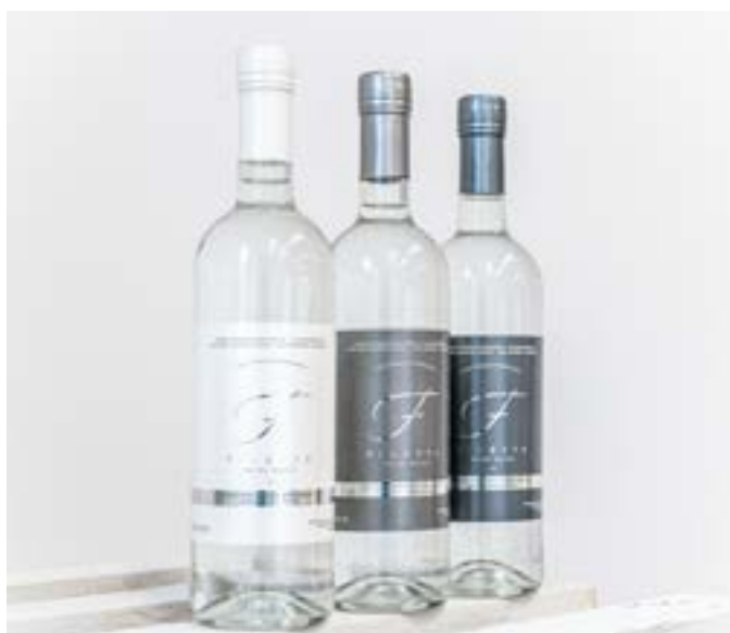
"La Bordolese" Naturale /Delicatamente Frizzante/ Frizzante