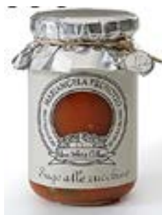
Sugo alle Zucchine