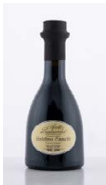
Aceto invecchiato TONDA