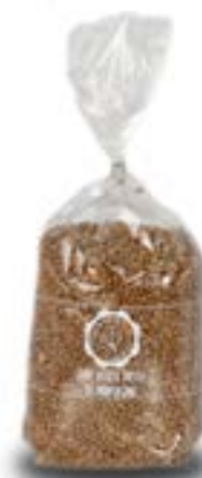
Lenticchie secche piccole rosse di montagna