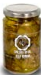
Carciofi interi alla Romana