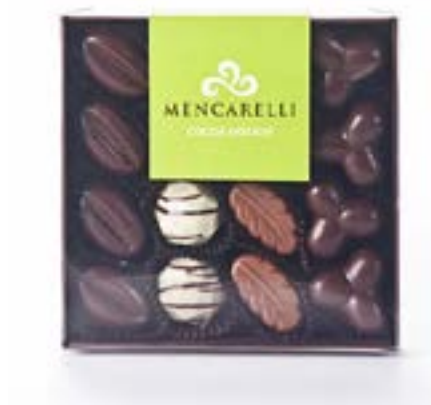
Scatola di cioccolatini