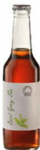
Tè Earl Grey Infuso di foglie di Earl Grey