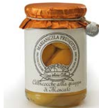
Albicocche alla grappa di Moscato