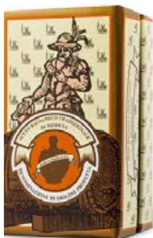
Aceto Balsamico Tradizionale "Affinato Produttori"