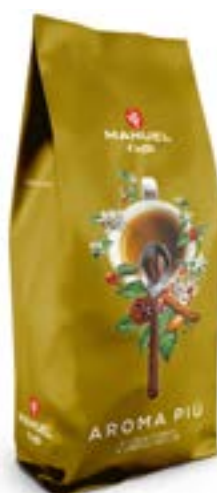
Miscela Caffè "Aroma Più"