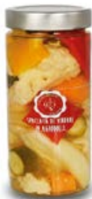
Spaccata di verdure in agrodolce