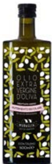
Essenza: Fruttato medio