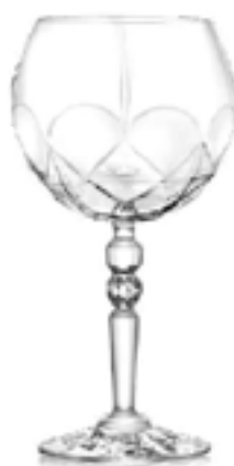
Alkemist Gin Tonic