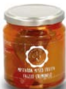
Mostarda misto frutta