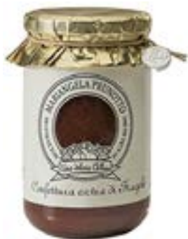
Confettura extra di Fragole