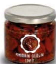
Pomodorini Ciliegino Confit