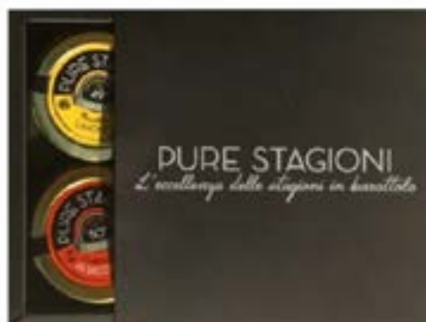
Gift Box 4 x 45 gr