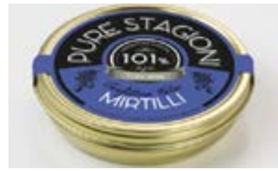
Confettura Extra di frutta