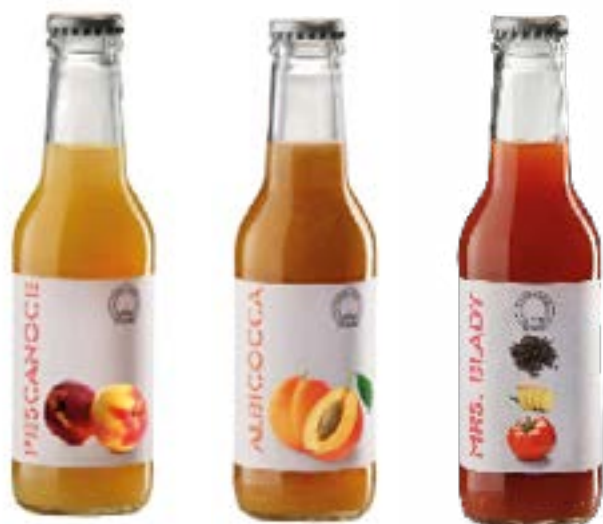
Succo Pesche Succo Albicocche Mrs Blady