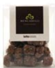
Bassinato Cocco Astuccio