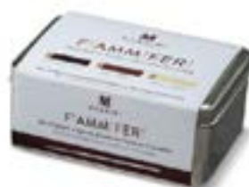
Scatola Latta Fiammiferi Mix