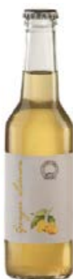
Ginger Lemon Infuso di foglie di tè aromatizzato con il limone