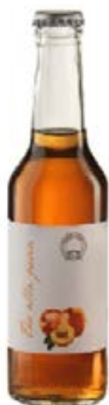
Tè alla pesca Infuso di foglie di tè aromatizzato alla pesca