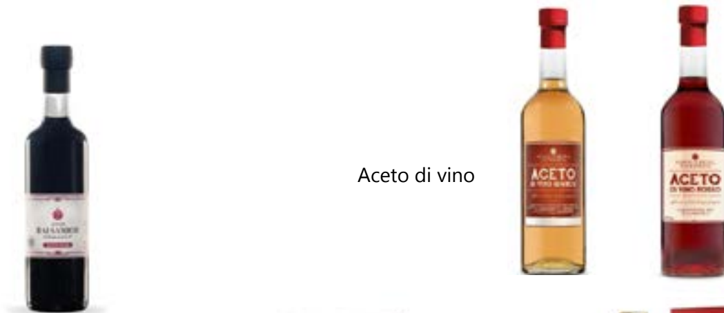
Aceto di vino