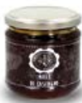
Miele di Castagno