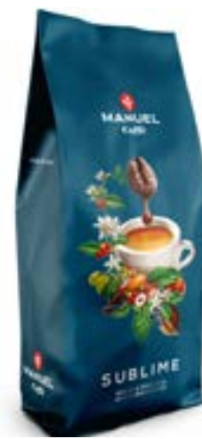
Miscela Caffè "Sublime"