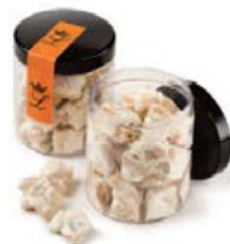
Pepite di Mandorlato duro