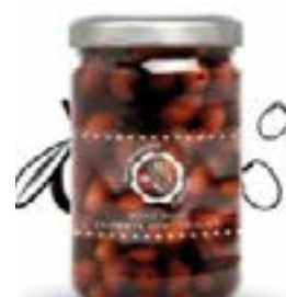
Olive nere denocciolate tipo kalamata