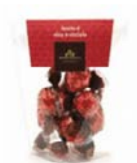
Rombo Liquorino visciole