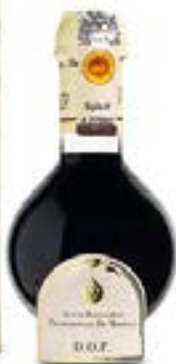
Aceto Balsamico di Modena IGP ORO - ARGENTO - NERA - ROSSA