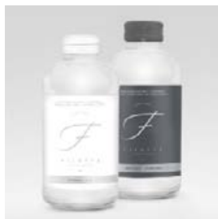
"La Spirit" Naturale e Frizzante