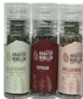
Condimento per insalata Timo Condimento per Barbecue