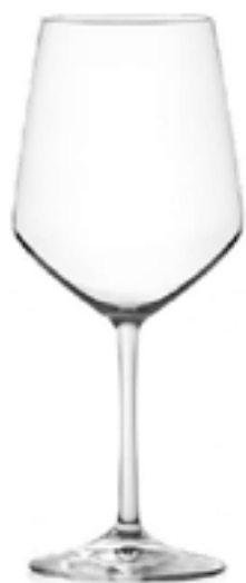
Universum U55 Quality