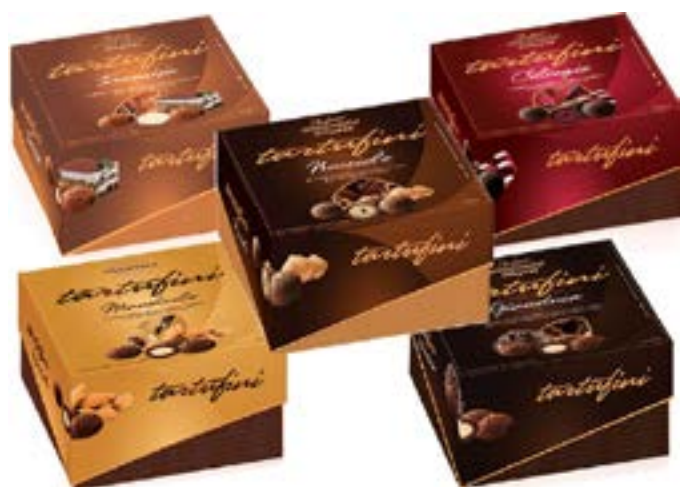
Tartufini Yogurt ai frutti di Bosco Babà con panna