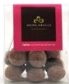
Bassinato Noce Macadamia Astuccio