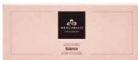
Tavoletta linea astuccio cioccolato bianco