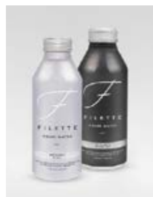
"La Futura" Naturale e Frizzante