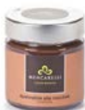
Crema spalmabile alla nocciola