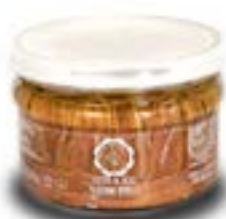
Filetti di alici distesi sott'olio