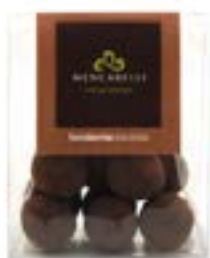
Bassinato Nocciola Fondente Astuccio