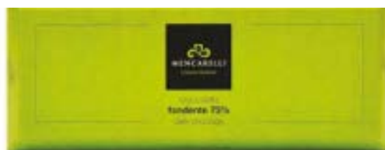
Blocchi di cioccolato 500 gr (misure 25 x 10 x 2,5 cm h)