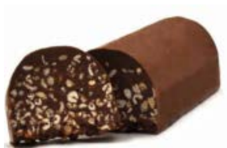
Cremino al latte con Farro soffiato