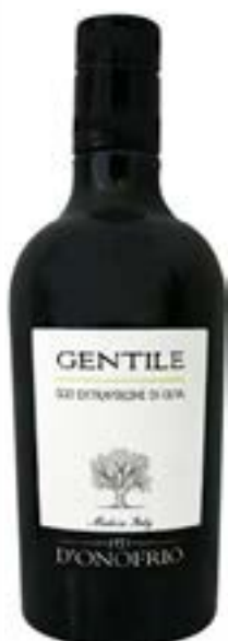
Olio Evo "Gentile" Fratelli D'Onofrio