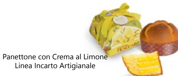
Panettone con Crema al Limone Linea Incarto Artigianale