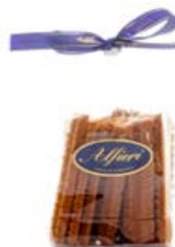
Brichet al burro