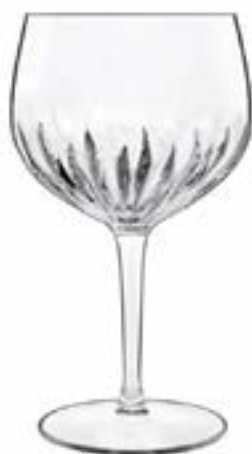
Mixology Spanish Gin&Tonic