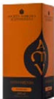
Condimento Supremo 200 ml