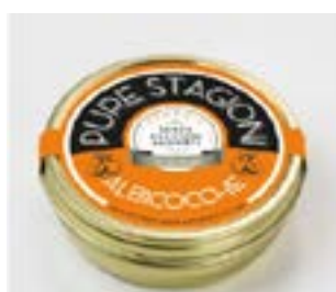
Armonia di Albicocche