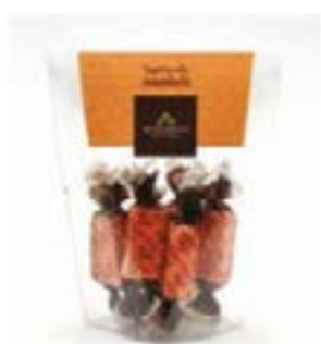
Rombo Torroncini Mandorla