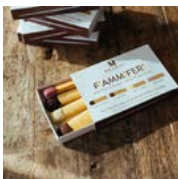
Fiammiferi Originale 4