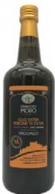
Olio Evo Orogiallo Frantoio Moro