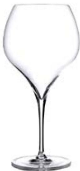
Ares 73 Ballon