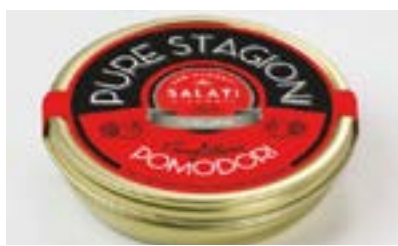
Confettura salata al pomodoro