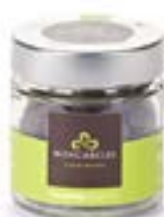
Bassinato al Pistacchio