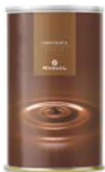
Ciocolata al Latte