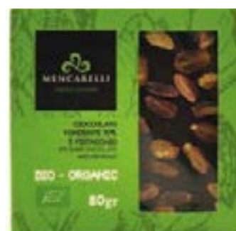
Cioccolato fondente 70% e pistacchio BIO