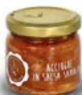
Acciughe in salsa saporita