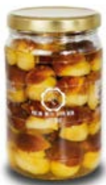
Porcini Testa Nera Interi