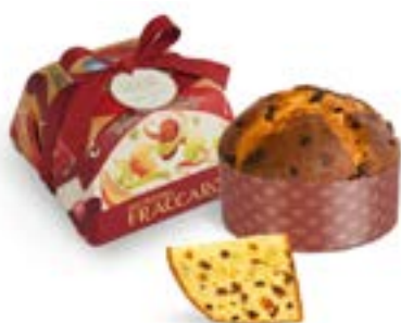
Panettone Antico Linea Incart Artigianale