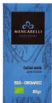
Tavoletta BIO cacao 100%