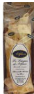
Lingue salate vaschetta