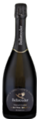
TRENTO DOC EXTRABRUT RISERVA 100% Chardonnay