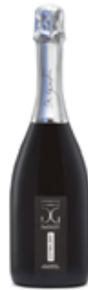
PROSECCO EXTRA DRY DOC METODO CHARMAT 85% Glera, 15% Uve generiche