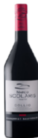
CABERNET SAUVIGNON COLLIO DOC 100% Cabernet Sauvignon