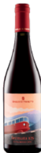
ETNA ROSSO DOC BIO FERMATA 125 100% Nerello Mascalese