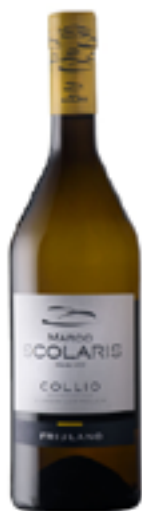
FRIULANO COLLIO DOC 100% Friuliano