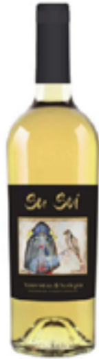
VERMENTINO DI SARDEGNA DOC "SU SOI" 100% Vermentino