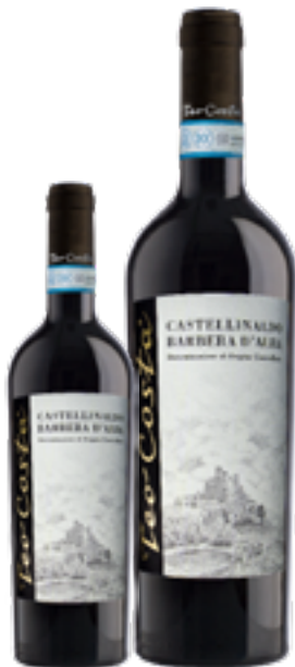
BARBERA D'ALBA DOC CASTELLINALDO 100% Barbera DISP. 1,5 L