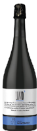
VINO SPUMANTE METODO CLASSICO PAS DOSÉ LUNIO Pinot Grigio e uve bianche autoctone

Tenuta San Bartolomeo è la storia di una famiglia, storia di persone, storia di cambiamenti. Sono questi gli ingredienti da cui l'azienda è partita per realizzare questo progetto, il progetto di una cantina nella alta Val Tiberina, un luogo non blasonato per la cura del vino, ma dalle prospettive sconfinite. Situata fra le frazioni di Resina e Parlesca nella parte nord del comune di Perugia, ad oggi l'azienda possiede circa sette ettari di vigne divisi fra Petit Verdot, Merlot, Grero, Pinot Nero, Vermentino, Trebbiano e Pinot Grigio. La tradizione del vino se la porta cucita sulla pelle. Oggi, come i loro nonni, allevano le viti senza tecniche invasive in campo. In cantina si reinterpretano concetti antichi, ma con la consapevolezza e la convinzione di vinificare oggi.