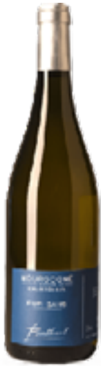
PUR SANS BOURGOGNE CHARDONNAY 100% Chardonnay