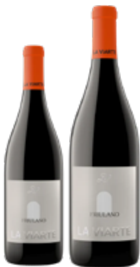
LINEA BIANCHI CLASSICI FRIULANO FRIULI COLLI ORIENTALI DOC 100% Friulano DISP. 1,5 L