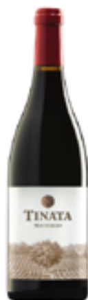
TOSCANA IGT TINATA 70% Syrah - 30% Grenache