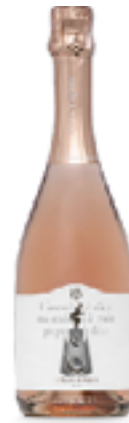
SPUMANTE BRUT MET. MARTINOTTI LA TORRE DI FUOCO 50% Chardonnay, 50% Shiraz