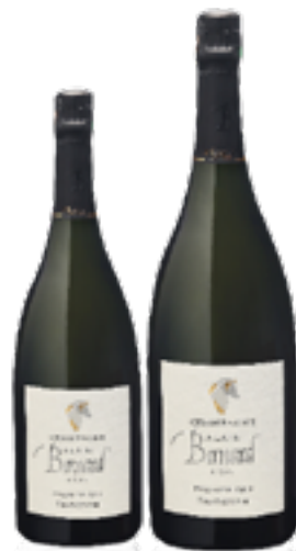
BRUT TRADITION PREMIERE CRU 60% Chardonnay, 35% Pinot Noir, 5% Meunier DISP. 1,5 L, 3 L

La pazienza, la disciplina ed il rispetto dei metodi tradizionali sono i valori adottati dall'azienda.