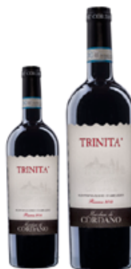
MONTEPULCIANO D'ABRUZZO RISERVA DOC TRINITA' 100% Montepulciano DISP. 1,5 L