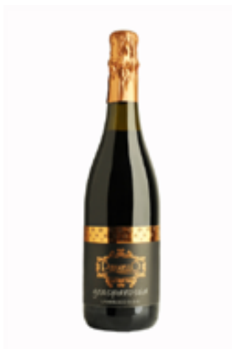
LAMBRUSCO GRASPAROSSA COLLI DI SCANDIANO E CANOSSA DOC 100% Grasperossa