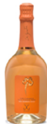
SPUMANTE DOLCE FIOR D'ARANCIO COLLI EUGANEI DOCG 100% Moscato Giallo