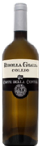
RIBOLLA GIALLA COLLIO DOC 100% Ribolla Gialla