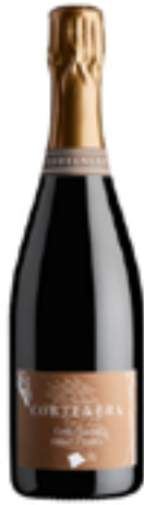
CUVÉE GINEVRA MILLESIMATO METODO CLASSICO 100% Garganega