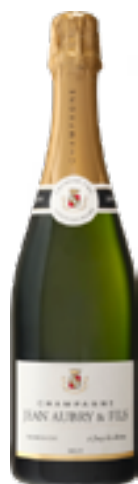
BRUT TRADITION Pinot Meunier, Chardonnay, Pinot Noir

La maggior parte delle viti ha tra i 25 ed i 30 anni; le "vecchie viti" producono meno ma spesso regalano vini complessi e profondi. La densità di impianto per ettaro è di 8.350 piante. La tipologia del terreno è argilloso-calcareo e sabbioso.