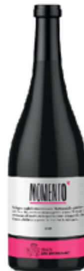
VINO ROSSO MOMENTO 100% Pinot Nero