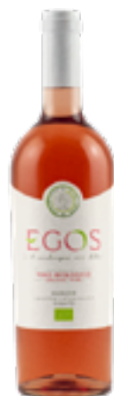
MARCHE ROSATO IGT EGOS 100% Sangiovese