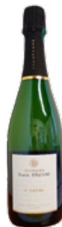
EXTRA BRUT "ET CAETERA" Chardonnay - Pinot Meunier - Pinot Noir