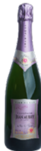
BRUT RESERVE Pinot Meunier, Chardonnay, Pinot Noir