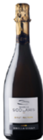
SPUMANTE RIBOLLA GIALLA BRUT NATURE 100% Ribolla Gialla