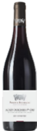
AUXEY-DURESSSES LES DURESSSES 100% Pinot Noir