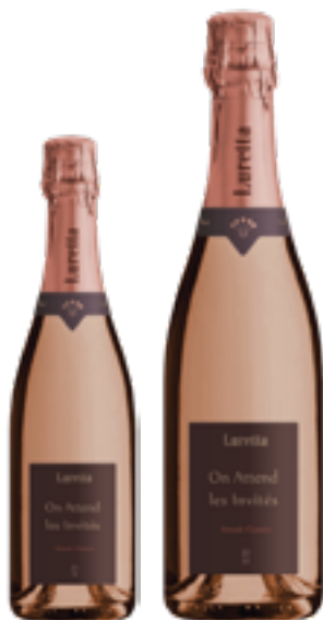
METODO CLASSICO ROSE' VSQ ON ATTEND LES INVITES 100% Pinot Nero DISP. 1,5 L