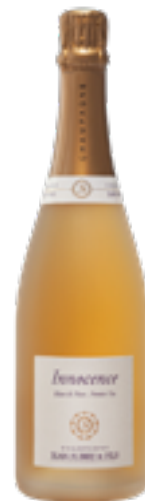
BLANC DE NOIRS "INNOCENCE" Pinot Noir