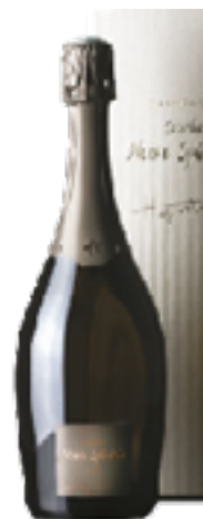
CUVÉE NOIRE SPECIALE 100% Pinot Noir Vieilles Vignes