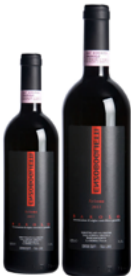
BAROLO DOCG ARIONE 100% Nebbiolo DISP. 1,5 L E 3 L