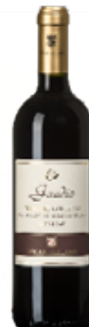
TERRE DEL COLLEONI MERLOT DOC GAUDIO 100% Merlot