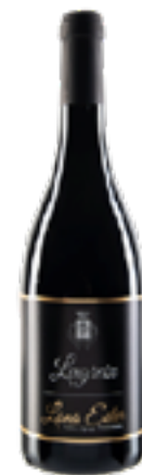
LAGREIN 100% Lagrein