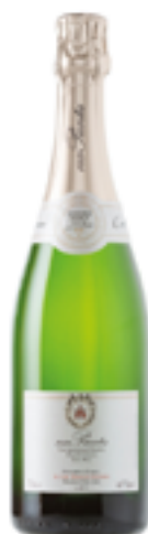
METODO CLASSICO BRUT NATURE VSQ NA PUNTA 100% Nebbiolo