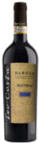
BAROLO DOCG MONROJ 100% Nebbiolo Lampia