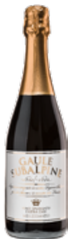
SPUMANTE DI ARNEIS EXTRA DRY MILLESIMATO GAULE SUBALPINE