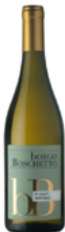
PINOT GRIGIO FRIULI DOC 100% Pinot Grigio