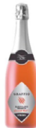
SPUMANTE BARDOLINO CHIARETTO DOC GRAFFIO METODO CHARMAT 65% Corvina, 25% Rondinella, 10% Molinara