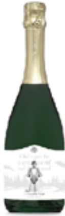
SPUMANTE EXTRABRUT L'ELFO DELLA NEVE 100% Chardonnay