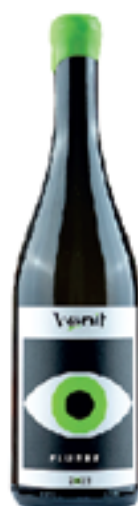
FLUERE VENEZIA GIULIA BIANCO IGT 100% Fleurtaï