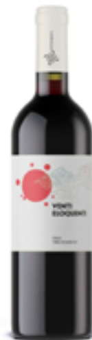
TERRE SICILIANE IGT BIO VEGANO VENTI ELOQUENTI ROSSO 100% Sirah