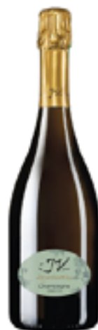
QVFMR - LES JARDINS D'ELISE 100% Chardonnay