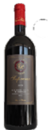
BOLGHERI ROSSO SUPERIORE DOC SUPREMO 100% Merlot