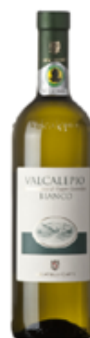
VALCALEPIO BIANCO DOC 75% Pinot Bianco e Chardonnay 25% Pinot Grigio DISP. 375 CL