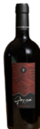
ISOLA DEI NURAGHI IGT "GASPA" 100% Cannonau