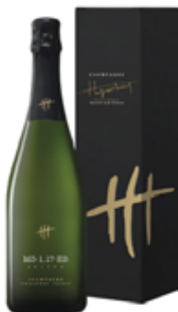
CUVÉE MYSTÈRE M3 1.17 - EB 100% Pinot Noir Solera dal 2004 al 2016