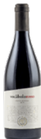
MARCHE ROSSO IGT VOCABOLO 40% Petit Verdot, 40% Merlot, 20% Sangiovese