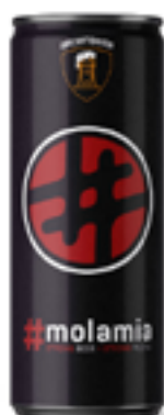
MOLAMIA STRONG ALE 7,8 % VOL

Chiara, ben maltata e leggermente luppolata, forte e decisa.