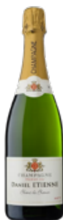
BLANC DE BLANCS 100% Chardonnay