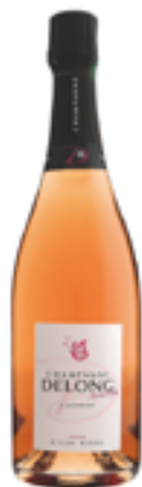
CUVÉE ROSÉ 40% Chardonnay - 45% Pinot Noir 15% Pinot Meunier