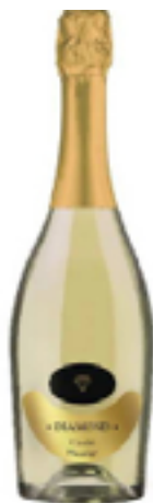
SPUMANTE EXTRA DRY DIAMOND 100% Chardonnay