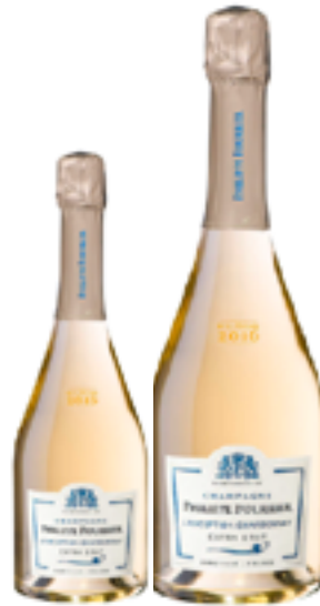
EXTRA BRUT "L'EXCEPTION" VINTAGE 100% Chardonnay DISP.: 1,5 L