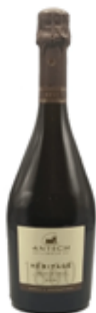
AOP CRÉMANT DE LIMOUX HERITAGE BRUT MILLESIME 60% Chardonnay - 20% Chenin 10% Mauzac - 10% Pinot Noir