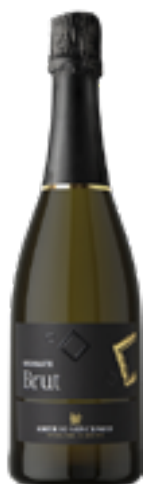
SPUMANTE BRUT Pinot Nero e Chardonnay