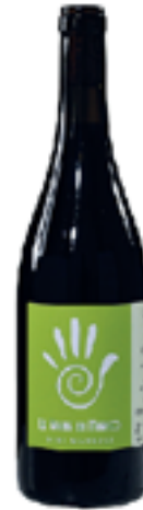
BABAJI IGT CABERNET FRANC VENETO 100% Cabernet Franc