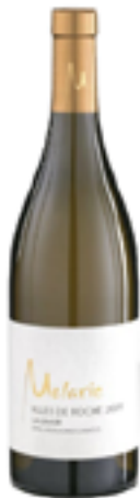
SAUMUR BILLES DE ROCHE 100% Chenint Blanc

peronospora. I vini sono affinati in botti da 4 ad 8 passaggi per periodi dai 18 ai 24 mesi. Nessuna aggiunta di lieviti selezionati e dosi di anidride solforosa molto deboli.