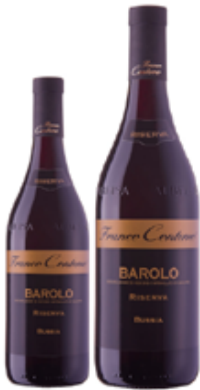
BAROLO RISERVA DOCG BUSSIA 100% Nebbiolo DISP. 1,5 L