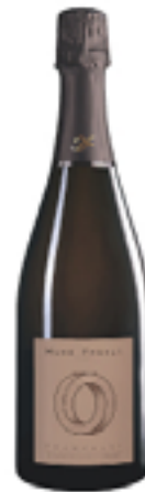
EXTRA BRUT MÉMOIRE 10% Chardonnay, 45% Pinot Noir 45% Pinot Meunier