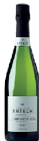
AOP CRÉMANT DE LIMOUX BRUT NATURE MILLESIME 70% Chardonnay - 30 % Chenin