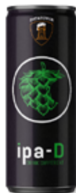
IPA-D INDIA PALE ALE 5,8 %

Chiara, ben maltata e leggermente luppolata, forte e decisa.