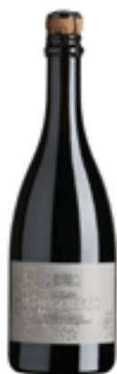
LAMBRUSCO REGGIANO DOC CONTRADA BORGOLETO 30% Salamino, 30% Lambrusco Marini, 30% Lambrusco Maestri, 10% Ancellotta