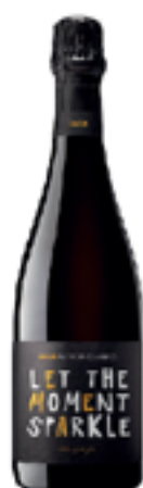
EMÉA METODO CLASSICO CON GRAZIA DOSAGGIO ZERO 100% Chardonnay