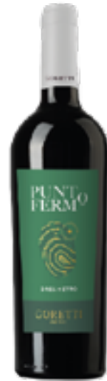
GRECHETTO UMBRIA IGT PUNTO FERMO 100% Grechetto