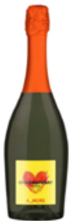
SPUMANTE CHARD. EXTRA DRY ANDMORE 100% Chardonnay

Nel settembre 1996 avviene la messa in opera delle Cantine di Silvano d'Orba (6.000 metri quadrati di superficie aziendale) dotate delle più moderne attrezzature che permettono il controllo dell'intero processo produttivo e distributivo del vino.