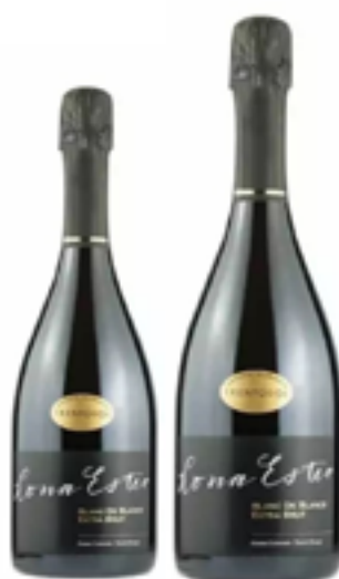
BLANC DE BLANCS EXTRA BRUT MILLESIMATO 100% Chardonnay DISP. 1,5 L

Qui, su terreni coltivati a vite su audaci terrazzi, che quasi sembrano sfidare le leggi di gravità, si trovano i vigneti della famiglia, tra un suggestivo paesaggio che vede l'alternanza di dolci colline e ripidi pendii. Un ambiente estremo, con il quale la cantina trentina si è confrontata con sacrificio e umiltà, riuscendo a produrre delle etichette uniche, dal sapore e dai profumi inconfondibili.