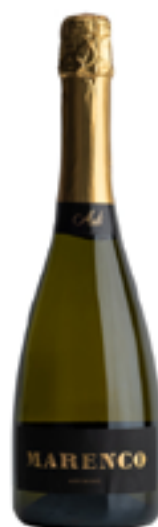
MOSCATO SPUMANTE D'ASTI DOCG BIO 100% Moscato Bianco