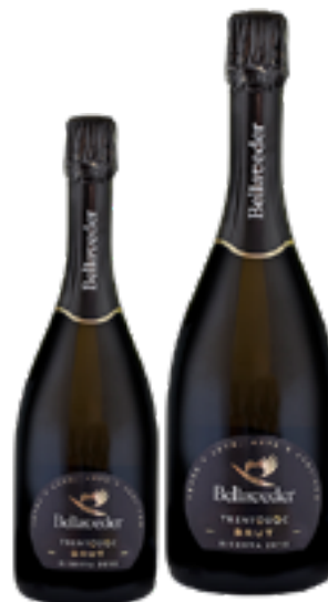
TRENTO DOC BRUT RISERVA MILLESIMATO 100% Chardonnay DISP. solo 1,5 L, 3 L