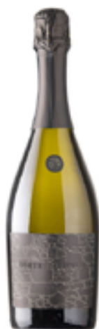
VINO SPUMANTE DIRADO BIO METODO CHARMAT 100% Garganega