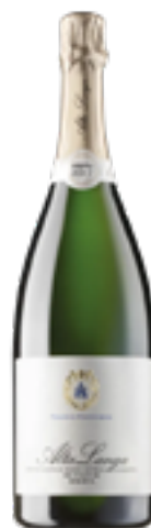
ALTA LANGA RISERVA DOCG BRUT NATURE METODO CLASSICO Pinot Nero e Chardonnay