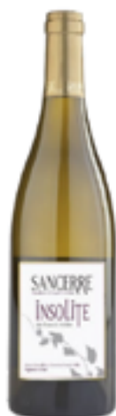
AOC SANCERRE BLANC SEC INSOLITE 100% Sauvignon