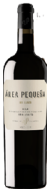
LOS LLANOS VINO ROSSO AREA PEQUENA 80% Tempranillo, 10% Garnacha, 10% Viura)