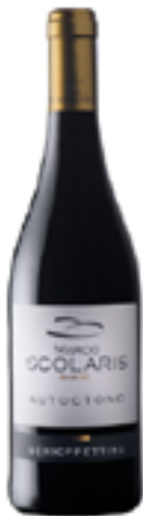
SCHIOPPETTINO VENEZIA GIULIA IGT 100% Schioppettino