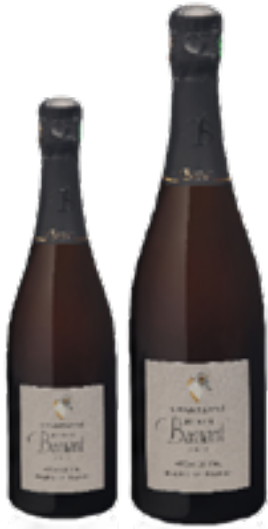
BLANC DE BLANCS PREMIERE CRU DE DIZY 100% Chardonnay DISP. 1,5 L