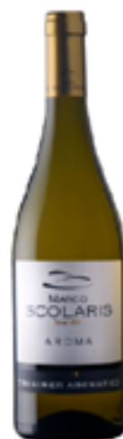
TRAMINER AROMATICO VENEZIA GIULIA IGT 100% Gewurztraminer