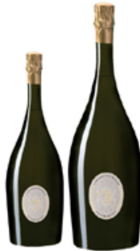
BRUT NATURE HISTORIE DE FUT 100% Chardonnay DISP. 1,5 L