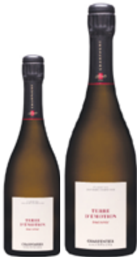
BRUT VERITE TERRE D'EMOTION 70% Chardonnay 15% Pinot Meunie - 15% Pinot Noir DISP. 1,5 L