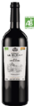
CHÂTEAU LE BERGEY CUVÉE PRESTIGE 65% Merlot - 20% Cabernet Franc 15% Malbec