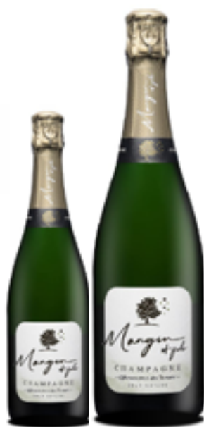
BRUT NATURE 100% Pinot Meunier DISP. 1,5