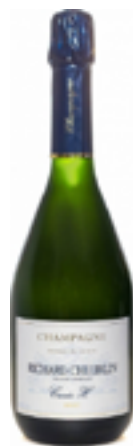
BRUT CUVÉE H 50% Chardonnay - 50% Pinot Noir