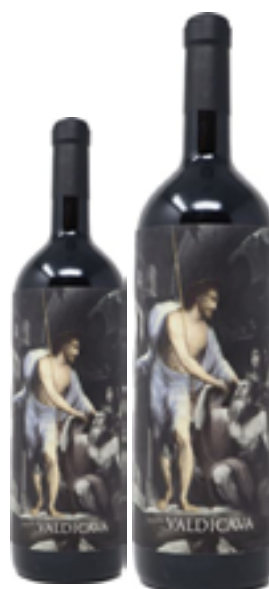
VIGNA MONTOSOLI 100% Sangiovese DISP. 1,5 L