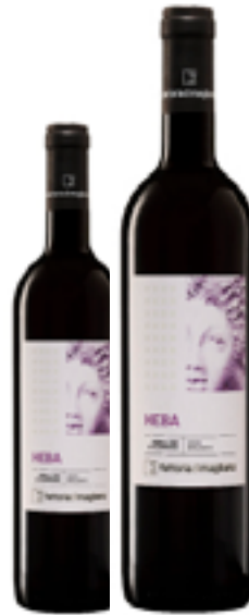
MORELLINO DI SCANSANO BIO DOCG HEBA 95% Sangiovese - 5% Syrah DISP. 0.375 L, 1.5 L, 3 L