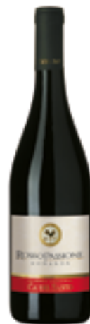
BONARDA FERMA DELL' O.P. DOC ROSSO PASSIONE 100% Croatina