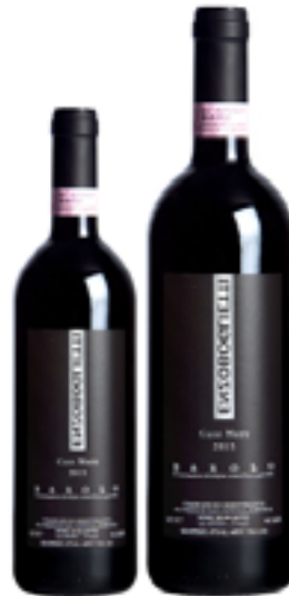
BAROLO DOC CASE NERE 100% Nebbiolo DISP. 1,5 L E 3 L