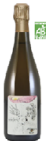
BRUT NATURE ROSE' PREMIER CRU TRADITION LA MASURE 100% Pinot Noir