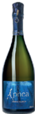
APNEA VINO SPUMANTE METODO CLASSICO 100% Pinot Nero