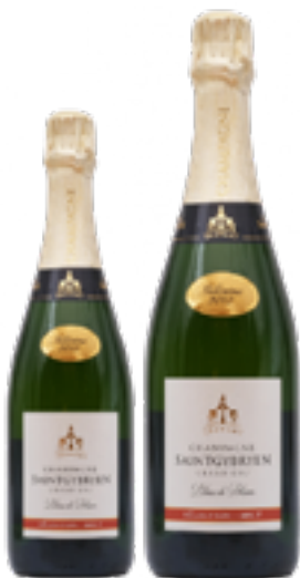
SELECTION GRAN CRU MILLÈSIME 100% Chardonnay DISP. 1,5