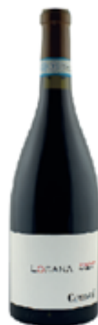
LOSANA VINO ROSSO RISERVA DOP 100% Pinot Nero