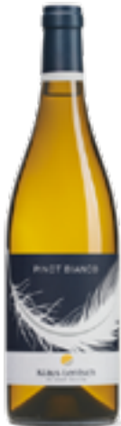
PINOT BIANCO SÜDTIROL / ALTO ADIGE DOC 100% Pinot Blanc