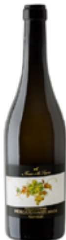
MOSCATO D'ASTI DOCG CANELLI PIASA SAN MAURIZIO 100% Moscato D'Asti