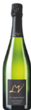
BDB EXTRA BRUT GRAND CRU LES LONGUES VERGES 100% Chardonnay