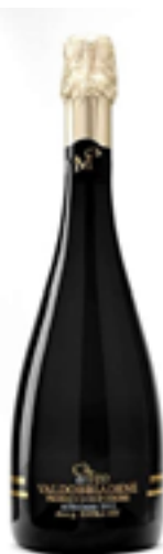
PROSECCO VALDOBBIADENE SUPERIORE EXTRA DRY DOCG METODO CHARMAT 100% Glera