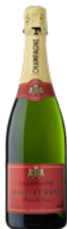
BLANC DE NOIR 100% Pinot Nero