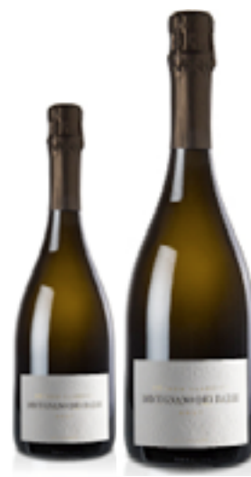
BRUT METODO CLASSICO MILLESIMATO Chardonnay e Pinot Nero