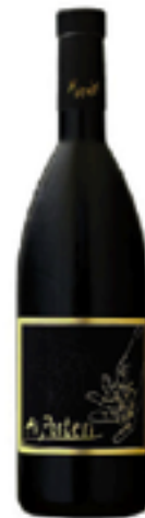
CANNONAU DI SARDEGNA DOC ISOLA DEI NURAGHI IGT "AI POSTERI" 100% Cannonau