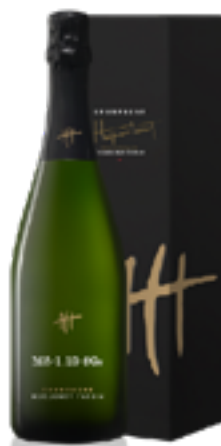
CUVÉE MYSTÈRE M5 1.19 - S02 100% Pinot Noir Sans Soufre