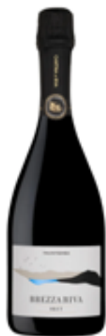
SPUMANTE METODO CLASSICO TRENTO DOC "BREZZA RIVA" 100% Chardonnay

Nel 1926 nasce l'Associazione Agraria Riva del Garda, col fine di promuovere e sostenere l'agricoltura nell'Alto Garda. La Cantina venne fondata nel 1957, mentre nel 1965 inizia l'attività del Frantoio. "Dal 2000 siamo una società cooperativa, per dare maggiore rilievo alle attività produttive della Cantina e del Frantoio, con costante rinnovo e aggiornamento tecnico degli impianti, all'avanguardia nei rispettivi settori."