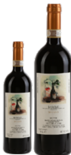
BAROLO DOCG SORANO 100% Nebbiolo DISP. 1,5 L, 3 L