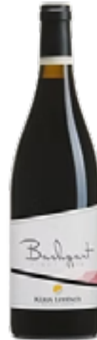
BACHGART PINOT NERO SÜDTIROL 100% Pinot Nero