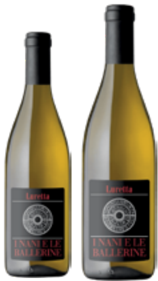
SAUVIGNON BLANC COLLI PIACENTINI DOC I NANI E LE BALLERINE 100% Sauvignon Blanc DISP. 1.5 L