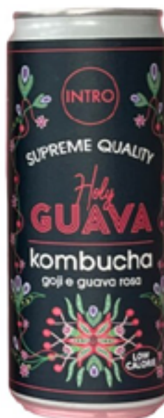
KOMBUCHA HOLY GUAVA CON GUAVA E GOJI