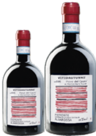
PIEMONTE DOC ALBAROSSA 100% Albarossa DISP. 1,5 L