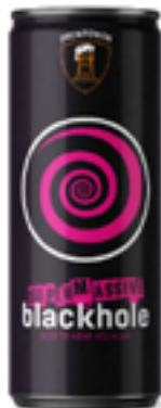
SUPERMASSIVE BLACK HOLE IMPERIAL STOUT 10,6 % VOL

Rossa, decisa, con un buon amaro bilanciato