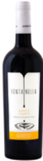
BIANCO UMBRIA IGT FONTANELLA BIANCO 50% Trebbiano Toscano, 50% Grechetto