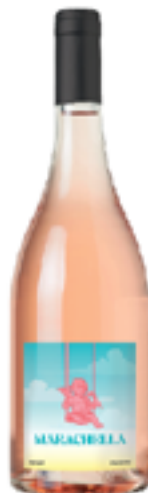
MARACHELLA Barbera, Croatina