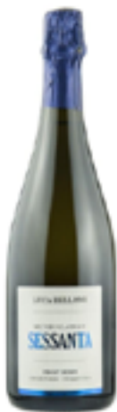
METODO CLASSICO DOSAGGIO ZERO SESSANTA 100% Pinot Nero

Grandi vini nascono da grandi vigneti. Nel comune di Oliva Gessi, uno dei territori della neonata Valle del Riesling, i terreni perfettamente gessosi e calcarei hanno suggerito l'impianto sul finire degli anni '70 di vigneti di Pinot Grigio, Pinot Nero e Bianco. Questi vitigni, primi nella zona, avrebbero rappresentato negli anni a venire il fiore all'occhiello della produzione aziendale.