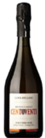
METODO CLASSICO DOSAGGIO ZERO ROSÈ CENTOVENTI 100% Pinot Nero