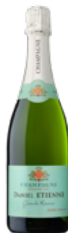
CHAMPAGNE ZERO DOSAGE Uvaggio Segreto