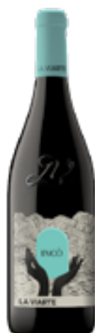
LINEA BLEND INCO' BIANCO FRIULI COLLI ORIENTALI DOC Friulano, Sauvignon, Malvasia, Riesling, Ribolla, Chardonnay e Pinot Bianco