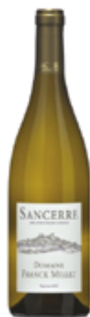
AOC SANCERRE BLANC SEC 100% Sauvignon