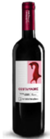
CIGLIEGIOLO MAREMMA TOSCANA BIO DOCG COSTA MADRE 100% Ciliegiole