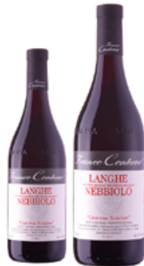
LANGHE NEBBIOLO DOC CASCINA SCIULUN 100% Nebbiolo DISP. 375 CL, 1,5 L, 3 L, 5 L, 9 L, 12 L