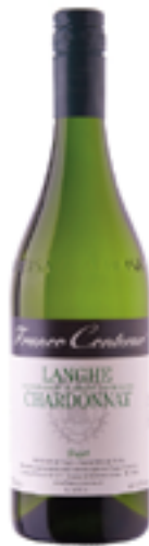
LANGHE CHARDONNAY DOC BUJET 100% Chardonnay