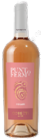
SANGIOVESE ROSATO UMBRIA IGT PUNTO FERMO 100% Sangiovese