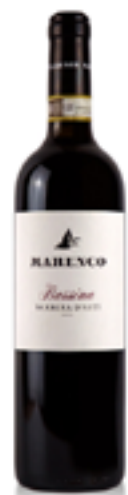
BARBERA D'ASTI DOCG "BASSINA" 100% Barbera