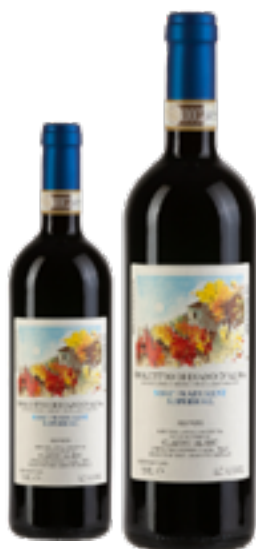
DOLCETTO DI DIANO D'ALBA SUPERIORE DOCG SORI' PRADURENT 100% Dolcetto DISP. 1,5 L