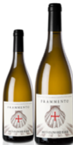
ORVIETO CLASSICO DOC FRAMMENTO 50% Grechetto - 20% Vermentino 20% Sauvignon - 10% Procanico DISP. 1,5 L