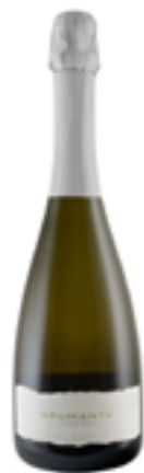
LINEA SPUMANTE SPUMANTE LUCIDO BRUT TERRE SICILIANE IGP 100% Lucido

Qui, il sole, il vento e il suolo fertile creano le condizioni perfette per la coltivazione di uve pregiate, valorizzando sia le varietà autoctone come Grillo, Catarratto e Nero d'Avola, sia quelle internazionali come Chardonnay, Syrah e Merlot. Dalla messa a dimora delle viti alla vendemmia, ogni fase segue un rigoroso protocollo di tracciabilità, garantendo il massimo rispetto per l'ambiente e la valorizzazione del terroir. Il nostro impegno per la sostenibilità si riflette nella cura del suolo, nell'uso responsabile delle risorse idriche e nella tutela della biodiversità.