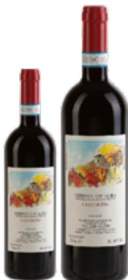
NEBBIOLO D'ALBA DOC CASCINOTTO 100% Nebbiolo DISP. 1,5 L, 3 L