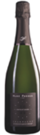
BRUT MILLÈSIME BLANC DE NOIRS INSTANTANÈE 80% Pinot Noir, 20% Pinot Meunier