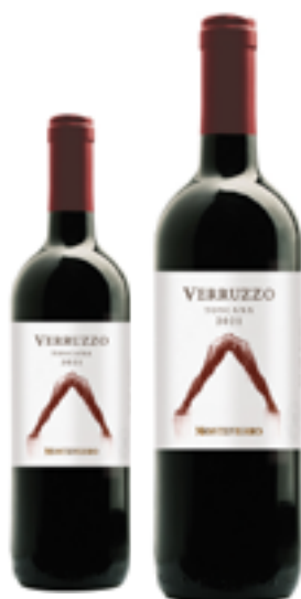
VERRUZZO TOSCANA ROSSO BIO IGT 40% Merlot - 25% Cab.Franc 25% Cab. Sauv. - 10% Sangiovese DISP. 1,5 L