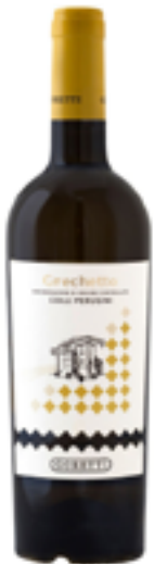
GRECHETTO DOC 100% Grechetto