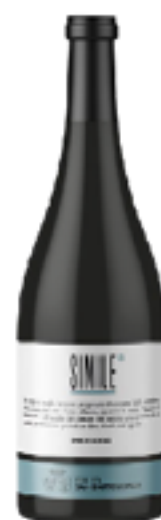
VINO BIANCO SIMILE 100% Pinot Grigio