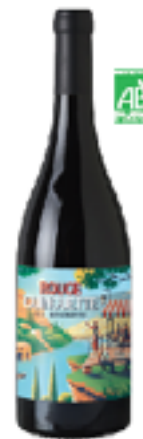
GUINGUETTE ROUGE Syrah, Grenache, Cinsault