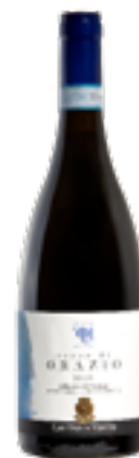
CLASSIC LINE AGLIANICO DEL VULTURE DOP TERRE D'ORAZIO 100% Aglianico