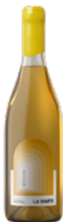
ZIJA MALVASIA NON FILTRATO FRIULI COLLI ORIENTALI DOC 100% Malvasia