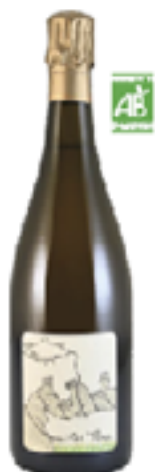
BRUT NATURE PREMIER CRU TRADITION ART'TERRE 40% Pinot Noir - 30% Pinot Meunier 30% Chardonnay