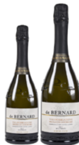
PROSECCO VALDOBBIADENE BRUT MILL. SUPERIORE DOCG 100% Glera DISP. 1,5 L