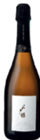
SANS FILTRES MILLESIMATO 100% Chardonnay