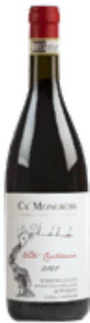
BARBERA D'ASTI SUP. DOCG VITI CENTENARIE COLLI ASTIANI 100% Barbera