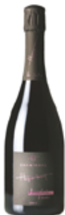
ROSÉ DE SAIGNÉE BRUT LES FIOLES CUVÉE ROSÉES 95% Pinot Noir - 5% Chardonnay