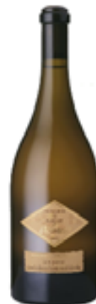
ANJOU BLANC AOC SEC ORDOVICIEN 100% Chenin Blanc