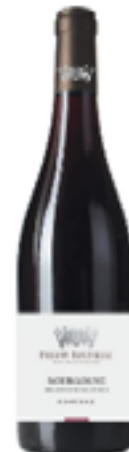
BOURGOGNE PINOT NOIR COTÈ D'OR ROUGE 100% Pinot Noir