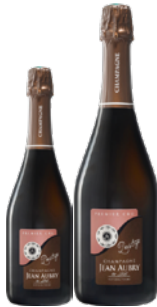
CUVÉE PRESTIGE Chardonnay, Pinot Noir DISP. 1,5 L, 3 L