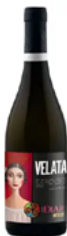
IGP TERRE SICILIANE ROSSO VELATA 100% Perrixicone