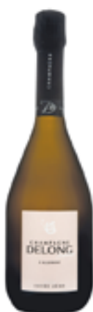
CUVÉE ZÉRO 70% Chardonnay - 26% Pinot Noir 4% Pinot Meunier