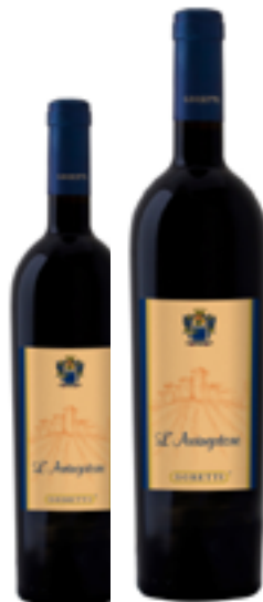
ROSSO DOC L'ARRINGATORE 60% Sangiovese, 30% Merlot, 10% Ciliegolo DISP. 1,5 L