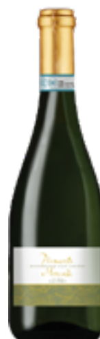
MOSCATO PIEMONTE DOC 100% Moscato