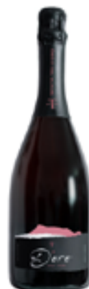
VINO SPUMANTE BRUT ROSE' MILLESIMATO "D'ORO ROSE" METODO CHARMAT 100% Cannonau spumantizzato