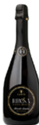
SPUMANTE BRUT METODO CLASSICO NATURE DOC VIGNA MONTE 100% Ribona