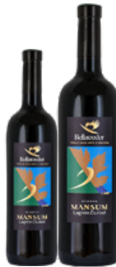
LAGREIN DUNKEL MANSUM TRENTINO RISERVA DOC 100% Lagrein DISP. 1,5 L