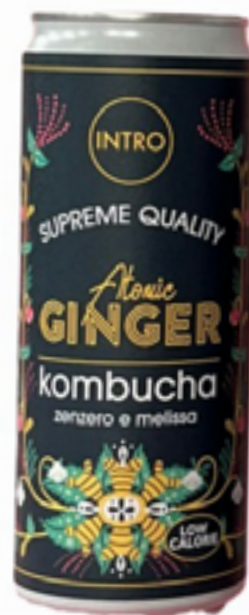
KOMBUCHA ATOMIC GINGER CON ZENZERO E MELISSA