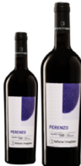
SYRAH MAREMMA TOSCANA DOC BIO PERENZO 100% Syrah DISP. 1.5 L, 3 L