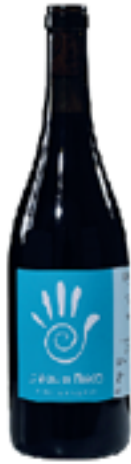
KUMARA 100% Merlot