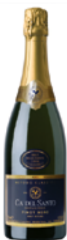
SPUMANTE MET. CLASS. PINOT NERO BRUT NATURE DOCG 100% Pinot Nero

Il nostro impegno è quello di cercare ogni giorno di migliorare in tutte le fasi: dalla produzione dell'uva, alla sua trasformazione fino alla commercializzazione del prodotto finito.”