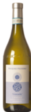
LANGHE FAVORITA DOC EMANUELLA 100% Favorita