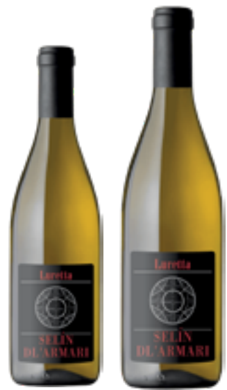
CHARDONNAY COLLI PIACENTINI DOC SELIN DL' ARMARI 100% Chardonnay DISP. 1.5 L