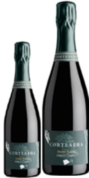
DURELLO RISERVA MILLESIMATO METODO CLASSICO DOSAGGIO ZERO 100% Durella DISP. 1,5 L