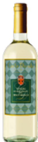
PINOT B. DEL VENETO IGT "CORTE DORATA" 100% Pinot Bianco