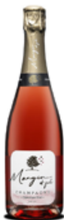
BRUT ROSÈ 100% Pinot Meunier