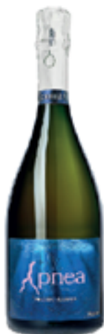
APNEA VINO SPUMANTE ROSE' METODO CLASSICO 100% Pinot Nero