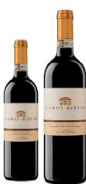
BAROLO LA MORRA DOCG 100% Nebbiolo DISP. 1,5 L