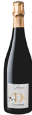
BLANC DE NOIRS BRUT NATURE EPHÉMÈRE 100% Pinot Meunier