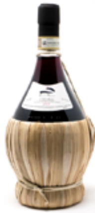
CHIANTI DOCG FIASCO 80% Sangiovese - 15% Colorino 5% Trebbiano e Malvasia