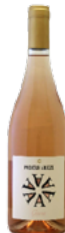
TOSCANA ROSATO GIOIA BIO IGT 100% Sangiovese