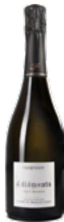
BRUT MILLÈSIME 4 ÉLÉMENTS - PINOT MEUNIER 100% Pinot Meunier