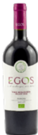
MARCHE MERLOT IGT EGOS 100% Merlot