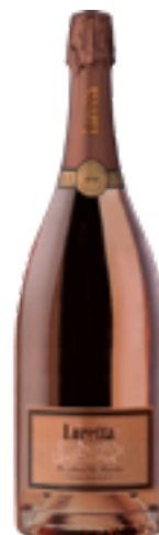
MET. CLASS. ON ATTEND LES INVITES RISERVA RONCOLINO 100% Pinot Nero