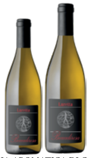
MALVASIA AROMATICA DI CANDIA COLLI PIACENTINI DOC "BOCCA DI ROSA" 100% Malvasia di Candia DISP. 1.5 L