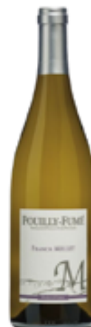
AOP POUILLY-FUMÉ 100% Sauvignon