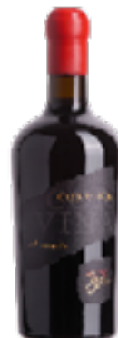
ROSSO VERONESE IGT CORVINA Corvina