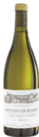
SAVIGNY-LES-BEAUNE VIEILLES VIGNES DOMAINE DE BELLENE 100% Chardonnay

Dopo la vendita della proprietà familiare a Volnay, a seguito del decesso del padre nel 1997, Nicolas Potel inizia la sua attività di négociant utilizzando come caves le vecchie cantine della stazione di Nuits Saint Georges. Solamente nel 2005 egli crea il proprio Domaine de Bellene ed il proprio négoce Maison Roche de Bellene, situato in uno stabile risalente al XVI secolo nel cuore pulsante di Beaune, e che costituisce a tutti gli effetti una maison 100% Bio nella capitale dei vini di Borgogna. Le vigne di proprietà del Domaine de Bellene, totale vitato di circa 23 ettari, si estendono da Santenay a Vosne Romanée, solo viti dai 50 ai 110 anni. La coltivazione avviene secondo il disciplinare biologico e la vinificazione segue scrupolosamente in tutte le sue fasi il calendario biodinamico. La vinificazione avviene facendo decantare i vini sufficientemente sulle fecce per 12-16 mesi senza travasi, con un minimo di SO 2 , protezione soprattutto dall'anidride carbonica da fermentazioni malolattiche tardive. I vini vengono travasati attraverso il broquereau, cioè l'apertura sul fondo della botte