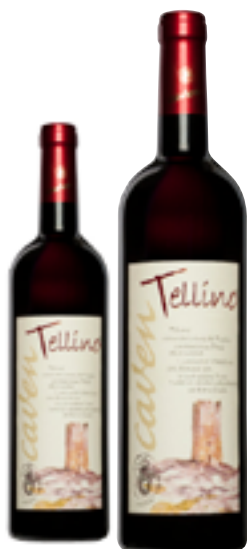
TERRAZZE RETICHE DI SONDRIO IGT TELLINO Nebbiolo, Pignola e Rossola DISP. 1,5 L

Una di queste testimonianze rupestri, senza dubbio quella di maggior interesse, viene custodita nel palazzo Besta di Teglio ed ha il nome di "Dea Madre", simbolo della fecondità e della laboriosità di quelle genti. E' stato realizzato inoltre un sentiero che attraversa i luoghi dei ritrovamenti all'interno dei vigneti dell'azienda, il "Sentiero archeologico di Caven".