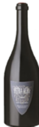
ANJOU ROUGE PETRA ALBA 100% Cabernet Blanc