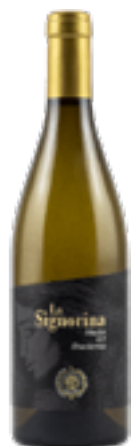
MARCHE CHARDONNAY IGT LA SIGNORINA 100% Chardonnay