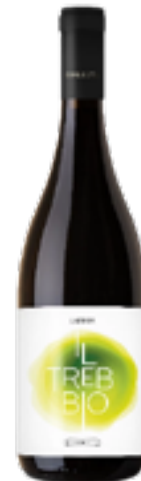
UMBRIA BIANCO IGT IL TREBBIO 100% Trebbiano Spoletino