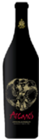
CANNONAU DI SARDEGNA DOC "ARCANOS" 100% Cannonau