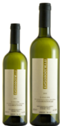
LANGHE CHARDONNAY DOC 100% Chardonnay DISP. 1,5 L