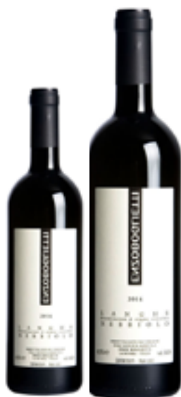
LANGHE NEBBIOLO DOC 100% Nebbiolo DISP. 1,5 L