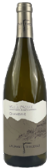
CHAMBAVE DOC 100% Petit Rouge