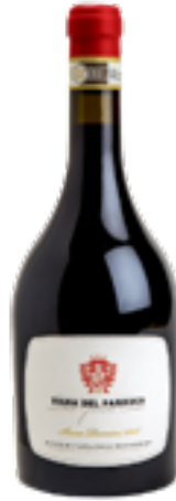
VIGNA DEL PARROCO 100% Ruchè