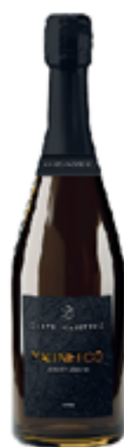
VINO SPUMANTE MAGNETICO METODO CLASSICO 80% Pinot Nero, 20% Chardonnay

Siamo un'azienda giovane che si rifà però alle proprie radici, che indaga le potenzialità del suo territorio e dei suoi prodotti migliori, che vuole portare nuove energie ed entusiasmo all'interno di una storia agricola millenaria.