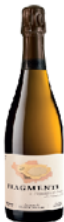
FRAGMENTS EXTRA BRUT 70% Pinot Noir - 30% Chardonnay

Questa giovane maison è nata dalla volontà dei suoi soci fondatori di mettere a profitto la loro complementarietà per un solo e medesimo mestiere, ossia “Eleveur de Grands Vins de Champagne”. Fondata solamente nel 2007 è già ben riconosciuta mondialmente soprattutto dopo aver consacrato i suoi primi anni d’esistenza all’esplorazione dei mercati stranieri, in particolare quello americano. Da subito la guide Parker gli ha attribuito delle note eccezionali per tutte le sue cuvées. Il vigneto a dominanza argillo-calcareo su suolo kimmeridgiano dona al pinot noir e allo chardonnay degli aromi e sapori particolarmente ricchi che acquisiscono una finezza ed un fruttato straordinari.