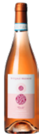
PIEMONTE ROSATO DOC CROSÈ 100% Nebbiolo