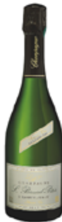
BRUT BLANC DE BLANCS PREMIER CRU MILLÉSIME 100% Chardonnay