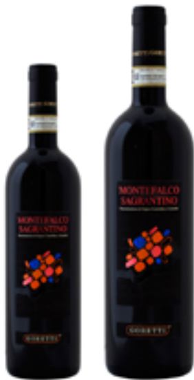
SAGRANTINO DI MONTEFALCO DOCG 100% Uve sagrantino DISP. 1,5 L