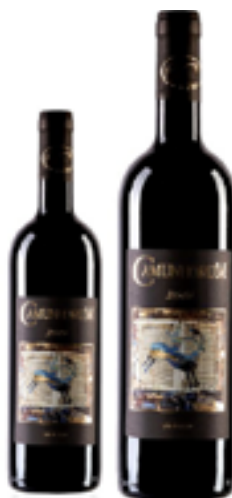
VALCAMONICA ROSSO IGT CAMUNNORUM 70% Merlot, 20% Marzemino, 10% Cabernet DISP. 1,5 L