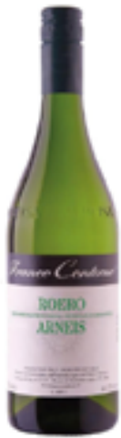
ROERO ARNEIS DOCG 100% Roero Arneis