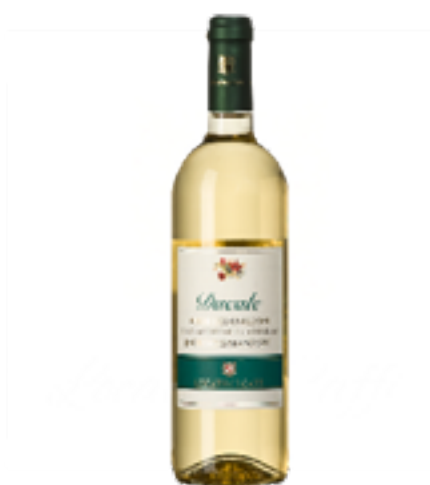
DUCALE INCROCIO MANZONI IGT BERGAMASCA 100% Incrocio Manzoni

Tradizione, innovazione, cultura e vocazione territoriale alla coltivazione vinicola guidano i nostri sforzi quotidiani nel produrre un vino tipico di qualità indiscussa. La favorevole esposizione al sole ed il terroir rendono la zona del Valcalepio un'area ideale per la coltivazione e produzione vinicola. La vendemmia è fatta manualmente nel rispetto delle più antiche tradizioni e l'uva viene raccolta in piccoli contenitori. Di generazione in generazione, i nostri Merlot e Cabernet sono stati selezionati e piantati con una densità di 7-9 tonnellate per ettaro.