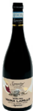
LACRYMA CHRISTI SUPERIORE ROSSO DOC BIO "VIGNALAPILLO" 80% Piediroso, 20% Aglianico