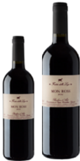
BARBERA D'ASTI DOCG MON ROSS 100% Barbera DISP. 1,5 L

Nel 1985 su incoraggiamento di Giacomo Bologna iniziava, con la surmaturazione dell'uva Moscato, la produzione del Moscato Passito Piasa Rischei che raggiungeva prestigiosi riconoscimenti e la pubblicazione sulla G.U. del 19 maggio 1992 della d.o.c. Loazzolo vendemmia tardiva. La Doc Loazzolo è attualmente considerata la più piccola d'Italia. L'Azienda è dal 2007 Oasi affiliata al WWF e dal 2011 Sede Didattica dell'Università di Scienze Gastronomiche di Pollenzo.