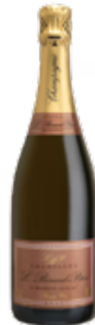
BRUT ROSE PREMIER CRU 74% Chardonnay - 20% Pinot Nero - 6% Pinot Noir vin in rosso