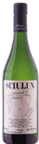
LANGHE BIANCO DOC SCIULUN 90% Chardonnay 10% Sauvignon