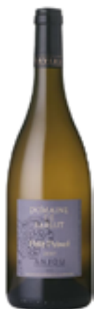
ANJOU BLANC AOC SEC PETIT PRINCÉ 100% Chenin Blanc