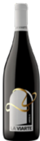
LINEA BLEND ARTEUS BIANCO FRIULI COLLI ORIENTALI DOC Chardonnay, Riesling, Friulano