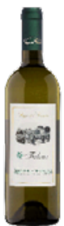
BOLGHERI VERMENTINO DOC FALENA 100% Vermentino

Vitigni rossi quali Merlot, Cabernet Franc, Sangiovese e il bianco Vermentino sono particolarmente idonei per questi terreni.