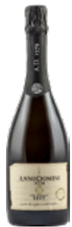
SPUMANTE BRUT ANNO DOMINI 1579 50% Chardonnay, 50% Verdicchio