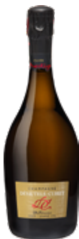
MILLESIME EXTRA BRUT GRAND CRU 100% Chardonnay