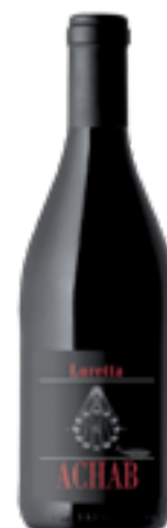
PINOT NERO COLLI PIACENTINI DOC ACHAB 100% Barbera DISP. 1,5 L, 3 L