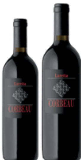
CABERNET SAUVIGNON COLLI PIACENTINI DOC "CORBEAU" 100% Cabernet Sauvignon DISP. 1,5 L