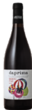
BARBERA D'ASTI DOCG DAPRIMA 100% Barbera