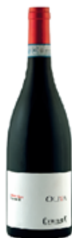
OLIVA VINO ROSSO RISERVA DOP 100% Pinot Nero