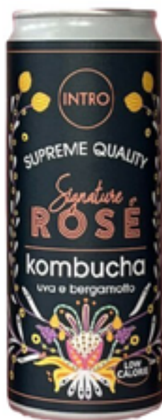
KOMBUCHA SIGNATURE ROSÈ CON UVA E BERGAMOTTO