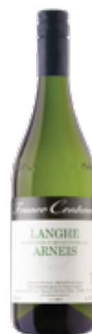
LANGHE ARNEIS DOC 100% Roero Arneis