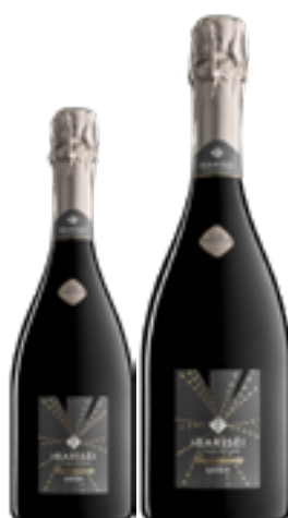
FRANCIACORTA DOCG SATÈN CUVÉE MILLESIMATA BRUT 100% Chardonnay DISP. 1,5 L E 3 L