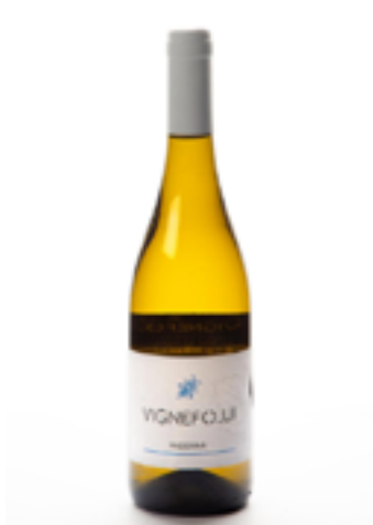
PASSERINA COLLINE PESCARESI IGT 100% Passerina

Dall'amore e dalla passione per il buon vino e per la condivisione nasce VigneFolli.