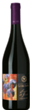
TREPODERI SANGUE DI GIUDA DELL'O.P. Croatina, Barbera, Uva Rara, Vespolina