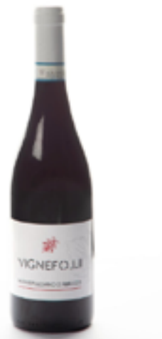
MONTEPULCIANO D'ABRUZZO DOC 100% Montepulciano