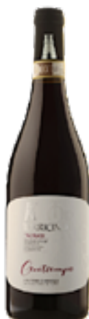
TAURASI DOCG "CEVOTIEMPO" 100% Aglianico