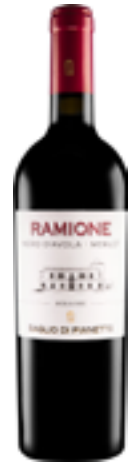
TERRE SICILIANE IGT BIO VEGANO RAMIONE Nero d'avola - Merlot