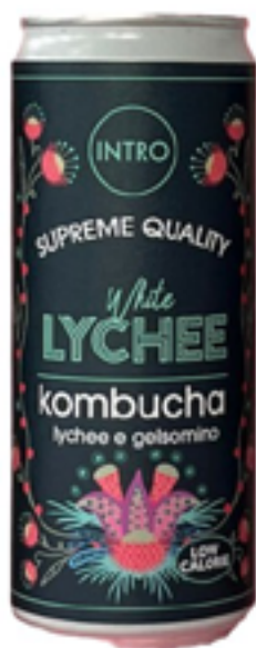
KOMBUCHA WHITE LYCHEE CON LYCHEE E GELSOMINO