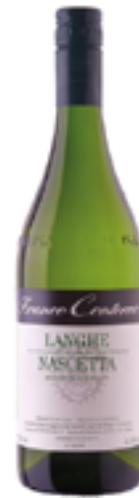
LANGHE NASCETTA COMUNE DI NOVELLO DOC 100% Nascetta