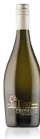
PROSECCO FRIZZANTE DOC TAPPO STELVIN 100% Glera