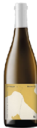
"IL VIAGGIO" BIANCO 01 100% Vermentino