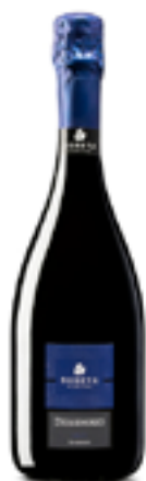
SPUMANTE BRUT DESIDERIO 100% Turbiana

“La curiosità verso ogni nuovo aspetto del nostro lavoro e il desiderio di scoprire metodi sempre più innovativi per ottenere il meglio dalla nostra materia prima d'eccellenza, sono da sempre parte della filosofia aziendale. Nascono così prodotti unici e curati in ogni dettaglio, frutto di anni di esperienza enologica e agronomica, capaci di raccontare di noi e dell'amore per il nostro lavoro.”