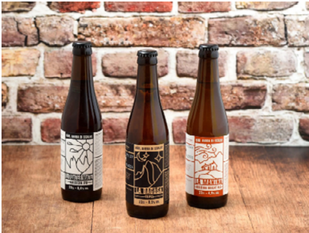
BAR QUATER MATE IPA