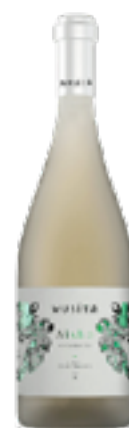
AYSHA CATARRATTO TERRE SICILIANE IGT LINEA MORI 100% Catarratto