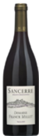
AOC SANCERRE ROUGE 100% Pinot Noir