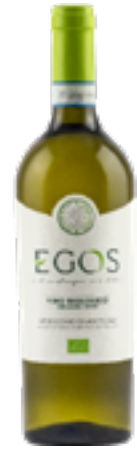
VERDICCHIO DI MATELICA BIO DOC EGOS 100% Verdicchio