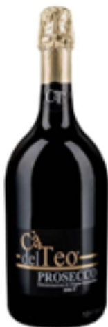
PROSECCO BRUT DOC METODO CHARMAT 100% Glera