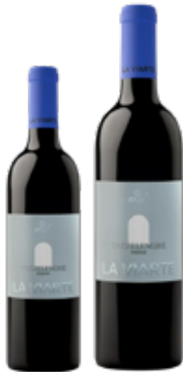
TAZZELENNGHE RISERVA FRIULI COLLI ORIENTALI DOC 100% Tazzelenghe DISP 1,5 L, 3 L