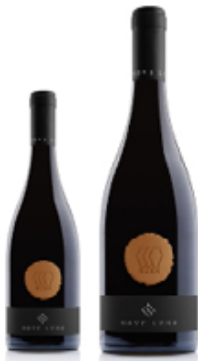
RUKH ORANGE WINE IN ANFORA BIO 50% Bronner - 50% Johanniter DISP. 1,5 L