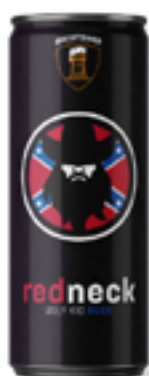
REDNECK RED STRONG ALE 7 % VOL

Chiara, ben luppolata con sentori agrumati ed un finale amaro