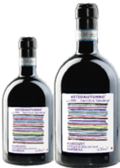
BARBERA PASSITO PIEMONTE DOC da Uve Stramature DISP. 1,5 L