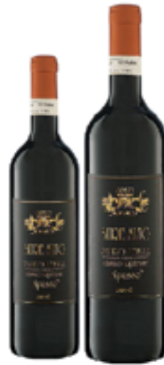
VALPOLICELLA RIPASSO SUPERIORE DOC BURE ALTO 65% Corvina-25% Corvinone-10% Rondinella DISP. 1,5 L