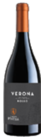
ROSSO VERONA IGP 90% Corvina - 10% Oseleta

Corte Pietra trova le Sue origini dal 1902 nella zona della “Valpolicella Classica”, dove, il Territorio ed il clima hanno consentito il particolare sviluppo dei vitigni autoctoni, da cui nascono i vini più pregiati. In cantina si continua il lavoro di valorizzazione intrapreso in campo. L'intenzione di intervenire il meno possibile è l'idea di fondo, in modo da lasciare esprimere l'intera potenzialità della materia prima senza sviare l'integrità territoriale: in questo momento di trasformazione viva avviene la sintesi di quello che sarà il loro vino.