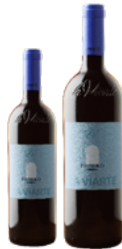
PIGNOLO RISERVA FRIULI COLLI ORIENTALI DOC 100% Pignolo DISP 1,5 L, 3 L