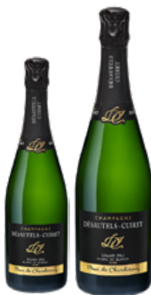
FLEUR DE CHARDONNAY BRUT GRAND CRU 100% Chardonnay DISP. 1,5 L