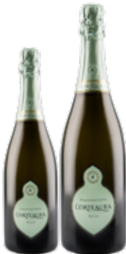
FRANCIACORTA DOCG BRUT 90% Chardonnay - 10% Pinot Nero DISP. 1,5 L, 3 L, 6 L

“Abbiamo unito queste due parole in un solo nome in omaggio alla nostra terra e, insieme, a quel soffio magico di vita che può rendere il frutto del nostro lavoro qualcosa di unico e superiore.”