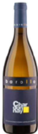
CHARDONNAY VENEZIA DOC 100% Chardonnay