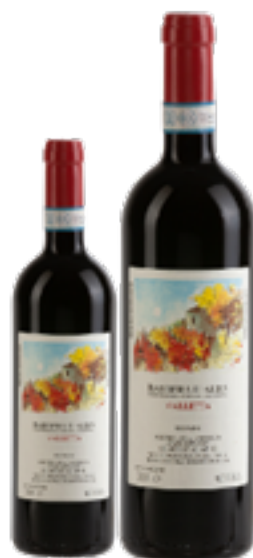
BARBERA D'ALBA SUPERIORE DOC VALLETTA 100% Barbera DISP. 1,5 L, 3 L