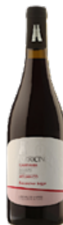
AGLIANICO CAMPANIA IGT "TORRICINO ROSSO" 100% Aglianico