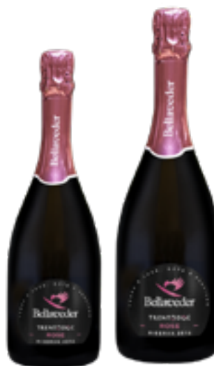
TRENTO DOC BRUT NATURE ROSÈ RISERVA BELLAVEDER 100% Pinot Nero DISP. 1,5 L