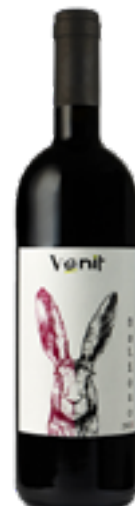
BALIOSO ALTA LIVENZA ROSSO IGT 100% Carmenere