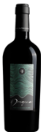
VERMENTINO DI SARDEGNA DOC "ORIGINA" 100% Vermentino