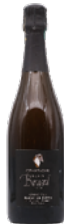
BLANC DE NOIRS Aÿ GRAND CRU BRUT NATURE 100% Pinot Nero