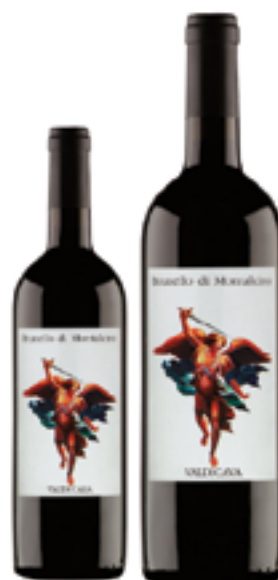
BRUNELLO DI MONTALCINO 100% Sangiovese grosso DISP. 1,5 L