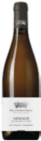
MEURSAULT LES GRANDS CHARRONS 100% Chardonnay