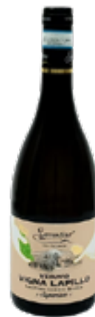
LACRYMA CHRISTI SUPERIORE BIANCO DOC BIO "VIGNALAPILLO" 80% Caprettone, 10% Greco, 10% Falanghina