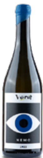
NEMO SOLARIS VENETO IGT 100% Solaris