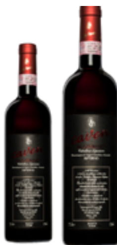
VALTELLINA SUP INFERNO RIS DOCG AL CARMINE 100% Nebbiolo DISP. 1,5 L E 3 L