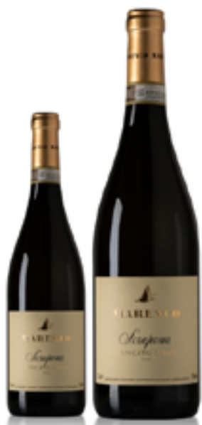
MOSCATO D'ASTI DOCG BIO SCRAPONA 100% Moscato Bianco DISP. 0,375 tappo a vite L e 1,5 L