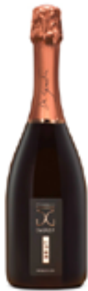
PROSECCO DOC BRUT METODO CHARMAT 85% Glera, 15% Uve generiche