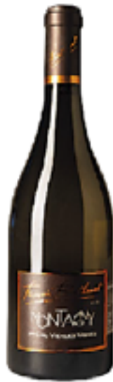
MONTAGNY 1ER CRU VIEILLES VIGNES 100% Chardonnay