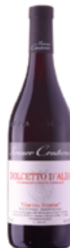
DOLCETTO D'ALBA DOC CASCINA SCIULUN" 100% Nebbiolo