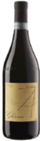
BARBERA D'ALBA RISERVA SUPERIORE DOC RUIT HORA 100% Barbera