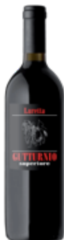
GUTTURNIO SUPERIORE GUTTURNIO DOC Barbera, Coatina