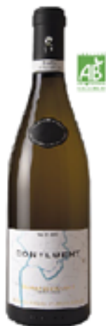
CONFLUENT 100% Melon de Bourgogne