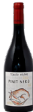
PINOT NERO TRENTINO DOC 100% Pinot Nero