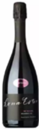
VINO SPUMANTE ROSÈ NATURE MILLESIMATO 80% Pinot nero, 20% Chardonnay