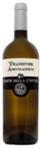
TRAMINER AROMATICO FRIULI DOC 100% Traminer Aromatico

Tutti i nostri prodotti, uniti alle Grappe e Distillati per l’ Ho.Re.Ca. che sono nati con il marchio della cantina, vengono consegnati insieme ai prodotti Ciemme Liquori, e permettono di dare un ampio assortimento di qualità a tutta la clientela Ho.Re.Ca.