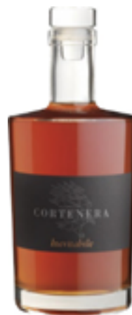
"INEVITABILE" VINO PASSITO 10 ANNI IN BARRIQUE 100% Garganega