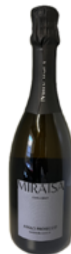
ASOLO PROSECCO DOCG SPUMANTE MIRAIISA 100% Glera