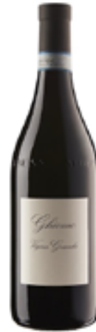
LANGHE NEBBIOLO DOC VIGNA GRANDA 100% Nebbiolo