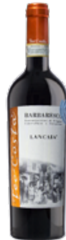
BARBARESCO DOCG LANCAIA 100% Nebbiolo Langia