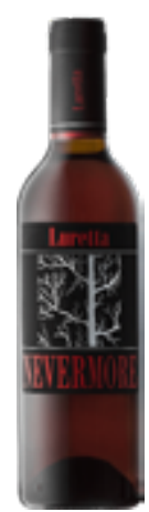
VINO BIANCO DOLCE PASSITO NEVERMORE DISP. 0.375 L