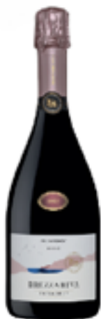
SPUMANTE METODO CLASSICO TRENTO DOC "BREZZA RIVA ROSE' EXTRA BRUT" 75% Pinot Nero 25% Chardonnay