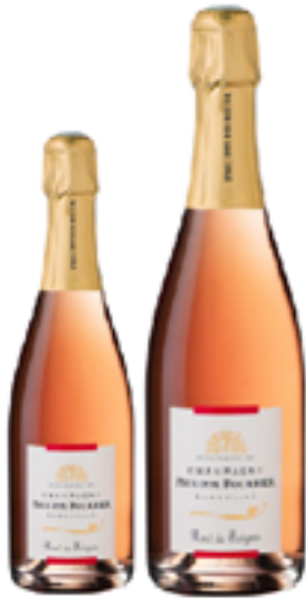
BRUT ROSE DE SAIGNEE 90% Pinot Noir, 10% Chardonnay DISP.: 0,375 L e 1,5 L