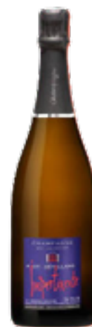
ESPRIT NATURE PINOT MEUNIER MILLESIMATO 100% Pinot Meunier