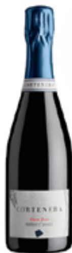
EXTRA BRUT MILLESIMATO METODO CLASSICO 90% Garganega, 10% Durella

Cortenera è un vino giovane ed innovativo che nasce dalla passione. Trattiamo le nostre uve Garganega e Durella seguendo il Metodo Classico coltivandole in un terroir con un valore aggiunto: il basalto colonnare. Dalla terra alla bottiglia, i nostri vini seguono una procedura principalmente ad ispirazione sostenibile, segno dell'inizio di una conversione totale a questa filosofia. La nostra cantina studiata nei minimi dettagli affinché l'impatto ambientale si avvicinasse naturalmente allo zero. Un progetto che ha richiesto un impegno costante e paziente per raggiungere il massimo dell'obiettivo.