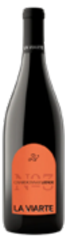
LINEA LIENDE CHARDONNAY FRIULI COLLI ORIENTALI IGT 100% Chardonnay