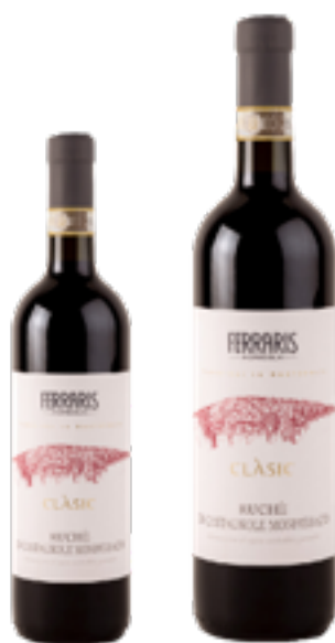
RUCHÈ DOCG CLASIC 100% Ruchè DISP. 1,5 L E 3 L