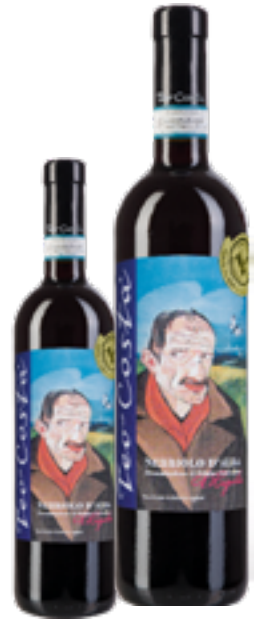
NEBBIOLO D'ALBA DOC LIGABUE 100% Nebbiolo DISP. 375 CL E 1,5 L