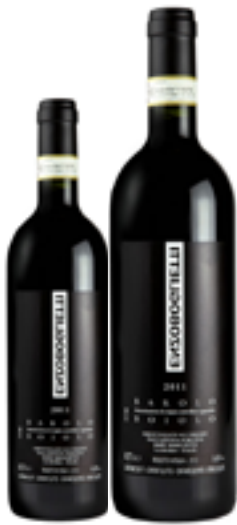
BAROLO DOCG BOIOLO 100% Nebbiolo DISP. 1,5 L