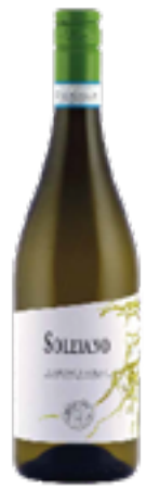
VERDICCHIO DI MATELICA DOC SOLEIANO 100% Verdicchio