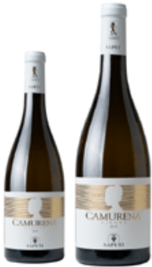
COLLI MACERATESI RIBONA DOC CAMURENA 100% Ribona DISP. 1,5 L