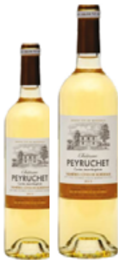
CHÂTEAU LES HAUTS CONSEILLANTS LALANDE DE POMEROL 85% Merlot, 15% Cabernet Franc DISP. 1,5 L