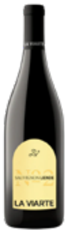
LINEA LIENDE SAUVIGNON FRIULI COLLI ORIENTALI DOC 100% Sauvignon Blanc