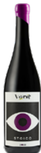
STOICO MERLOT KHORUS VENEZIA GIULIA IGT 100% Merlot Khorus