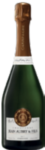
BLANC DE BLANCS "SYMPHONIE" 100% Chardonnay