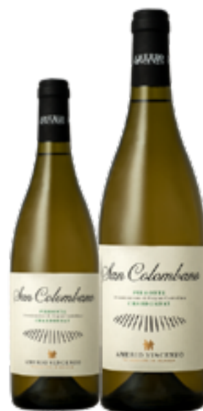
PIEMONTE CHARDONNAY DOC SAN COLOMBANO 100% Chardonnay DISP. 1,5 L