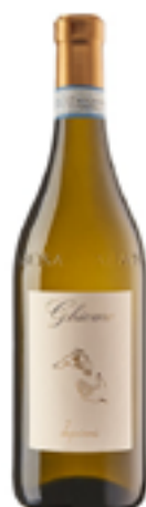
LANGHE ARNEIS DOC IMPRIMIS 100% Arneis