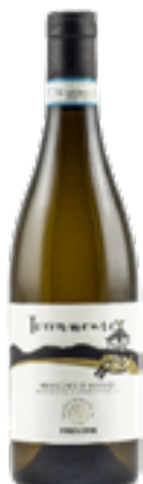
VERDICCHIO DI MATELICA DOC TERRAMONTE 100% Verdicchio