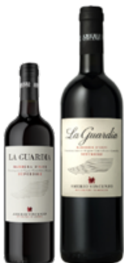
BARBERA D'ASTI SUPERIORE DOCG LA GUARDIA 100% Barbera DISP. 1,5 L