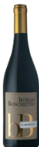
CABERNET VENEZIA GIULIA IGT 100% Cabernet