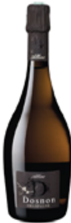
GRAN CUVEE ALLIAE 50% Pinot Noir - 50% Chardonnay