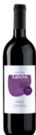
ROSSO TOSCANA S.S.A. IGT PRIVO 100% Sangiovese

Nel 1984 LaSelva fu la prima azienda non tedesca a ottenere la certificazione Naturland. Nella seconda metà degli anni Ottanta Egger avviò la trasformazione diretta di frutta e verdura, realizzando le prime conserve bio. Un percorso di rispetto per la natura e per l'alimentazione sana, che ha portato LaSelva a diventare un'azienda che si estende su una superficie di più di 800 ettari e che produce pregiate specialità gastronomiche e vini biologici.