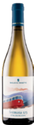
ETNA BIANCO DOC BIO FERMATA 125 100% Carricante