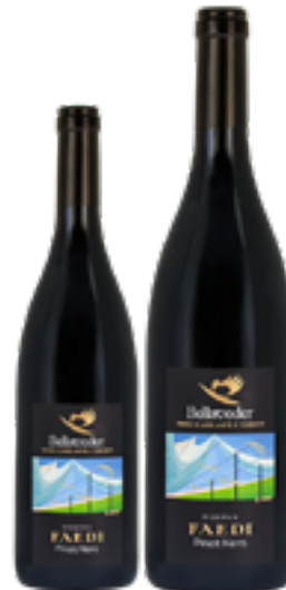
PINOT NERO FAEDI TRENTINO RISERVA DOC 100% Pinot Nero DISP. 1,5 L