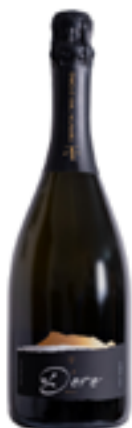
VERMENTINO DI SARDEGNA DOC VINO SPUMANTE BRUT MILLESIMATO "D'ORO" METODO CHARMAT