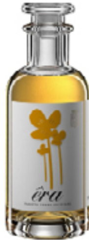
TERRE SICILIANE IGT ERA 100% Moscato