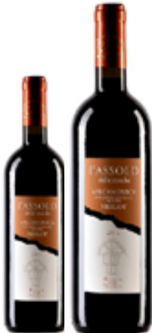
VALCAMONICA MERLOT IGT ASSOLO 100% Merlot DISP. 1,5 L