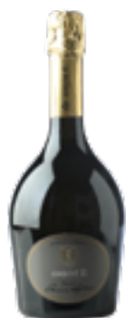
DOME' SPUMANTE METODO CLASSICO Blend di Primitivi

Nel cuore assolato della Puglia, tra distese di ulivi secolari e muretti a secco che disegnano l'orizzonte, nasce la nostra azienda vinicola: un luogo dove tradizione e innovazione si incontrano per dare vita a vini autentici, profondamente legati alla terra da cui provengono.