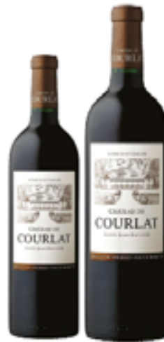
CHÂTEAU DU COURLAT CUVÉE JEAN BAPTISTE LUSSAC-ST. EMILION AOC 100% Merlot DISP. 1,5 L