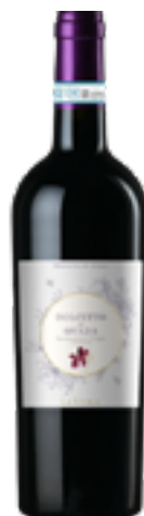
DOLCETTO DI OVADA DOC "LA VIOLA" 100% Dolcetto