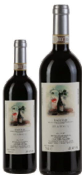
BAROLO DOCG RIVA ROCCA 100% Nebbiolo DISP. 1,5 L, 3 L