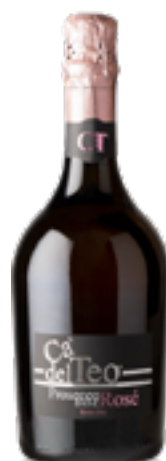
PROSECCO ROSÈ DOC EXTRA DRY METODO CHARMAT 90% Glera - 10% Merlot