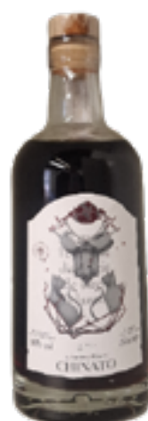
"LA LANTERNA MAGICA" CHINATO VINO AROMATIZZATO DA UVE MERLOT