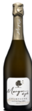
BRUT MILLESIMÉ 100% Pinot Meunier