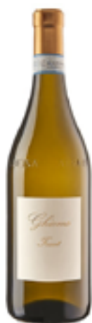
LANGHE ARNEIS DOC FUSSOT 100% Arneis

Ci tramandiamo da generazioni la passione per questo grande e difficile mestiere, fondata su onestà e rispetto della natura, non amiamo essere definiti biodinamici, biologici o convenzionali, ma solo contadini, chi lo è vive per il benessere della sua terra e di quello che coltiva.”