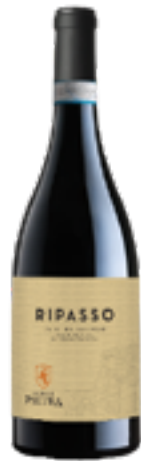
VALPOLICELLA RIPASSO DOP Corvina Ver - Rondinella Molinara