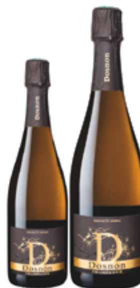
BLANC DE NOIRS EXTRA BRUT RÉCOLTE NOIRE 100% Pinot Noir DISP 1.5L