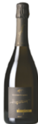
BRUT LES FIOLES CUVÉE PRESTIGE 80% Pinot Noir - 20% Pinot Blanc