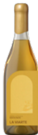
ZAL RIBOLLA NON FILTRATO FRIULI COLLI ORIENTALI DOC 100% Ribolla Gialla