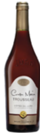
CÔTES DU JURA AOC TROUSSEAU 100% Trousseau