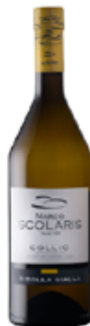
RIBOLLA GIALLA COLLIO DOC 100% Ribolla Gialla