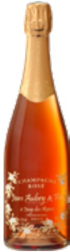
BRUT ROSÉ Pinot Meunier, Chardonnay, Pinot Noir