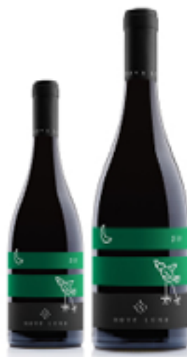
"310" VINO BIANCO AFFINATO IN LEGNO BIO 40% Solaris 30% Bronner 30% Johanniter DISP. ANCHE 1.5L