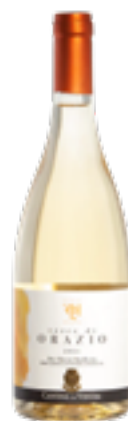
CLASSIC LINE DRY MUSCAT BASILICATA IGP TERRE D'ORAZIO 100% Moscato Bianco