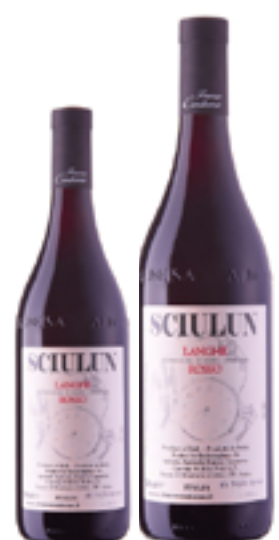
LANGHE ROSSO DOC SCIULUN 40% Nebbiolo - 30% Cabernet Sauvignon - 30% Barbera DISP. 1,5 L, 3 L