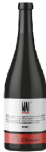
VINO ROSSO MAI 100% Merlot