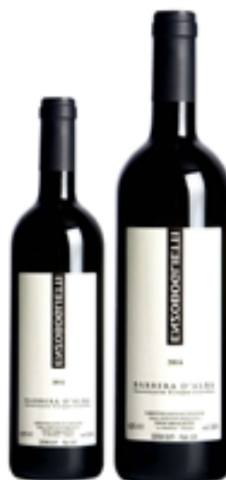
BARBERA D'ALBA DOC 100% Barbera DISP. 1,5 L