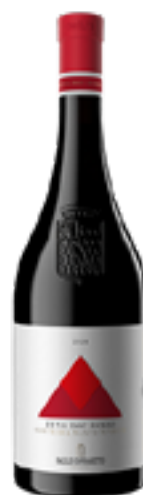
ETNA ROSSO DOC BIO CONTRADA SANTO SPIRITO 100% Nerello Mascalese