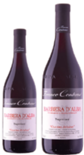
BARBERA D'ALBA SUPERIORE DOC CASCINA SCIULUN 100% Barbera DISP. 1,5 L, 3 L, 5 L, 9 L, 12 L