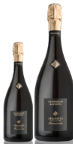
FRANCIACORTA DOCG RISERVA "FRANCESCO BATTISTA" 90 MESI - DOSAGGIO ZERO 65% Chardonnay, 35% Pinot Nero DISP. 1,5 L