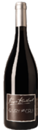
GIVRY 1ER CRU 100% Pinot Noir