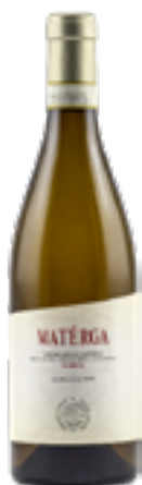
VERDICCHIO DI MATELICA DOCG RIS MATERGA 100% Verdicchio