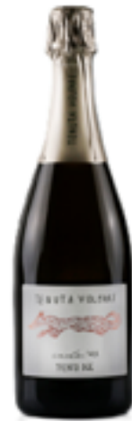
TRENTO DOC CUVÉE 41 (60% chardonnay 40% pinot nero )