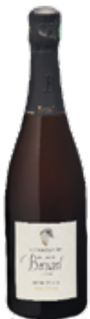
MILLÉSIME PREMIERE CRU CUVÉE VINTAGE 50% Chardonnay, 50% Pinot Noir