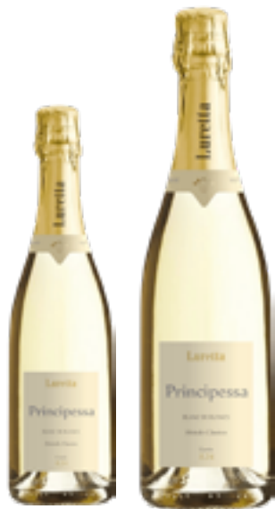
METODO CLASSICO VSQ PRINCIPESSA 100% Chardonnay DISP. 1,5 L e 3 L