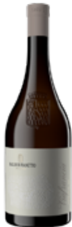
SICILIA BIANCO DOC BIO VIA FRANCIA BIANCO 100% Viognier