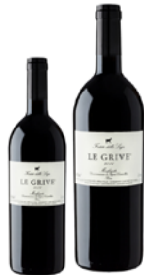
MONFERRATO ROSSO DOC LE GRIVE 50% Barbera - 50% Pinot Nero DISP. 375 CL E 1,5 L