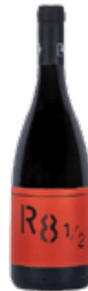
VINO ROSSO R 8 1/2 100% Nebbiolo