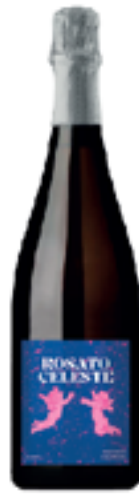
SPUMANTE ROSATO METODO CLASSICO CELESTE 50% Barbera, 50% Croatina