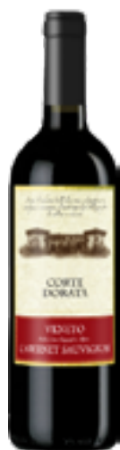
CABERNET SAUVIGNON VENETO IGT "CORTE DORATA" 100% Cabernet Sauvignon