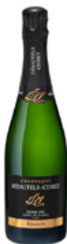
RESERVE GRAND CRU 100% Chardonnay