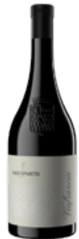
SICILIA ROSSO DOC BIO VIA FRANCIA Merlot - Cabernet Sauvignon