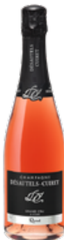
ROSE BRUT GRAND CRU 90% Chardonnay - 10% Pinot Noir