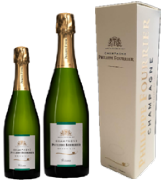
BRUT RESERVE 40% Chardonnay, 60% Pinot Noir DISP. 0,375 e 1,5 L