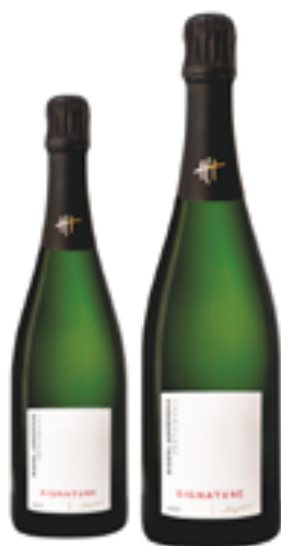
BRUT SIGNATURE 100% Pinot Noir DISP. 1,5 L

Coltivazione delle vigne nella massima naturalezza, seguendo i cicli del sole e della luna, adottando tecniche biologiche e di cultura ragionata con l'intento di salvaguardare gli interessi del pianeta e del palato.