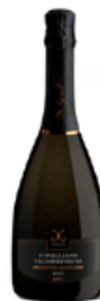
PROSECCO BRUT SUPERIORE DOCG METODO CHARMAT 85% Glera, 15% Uve generiche