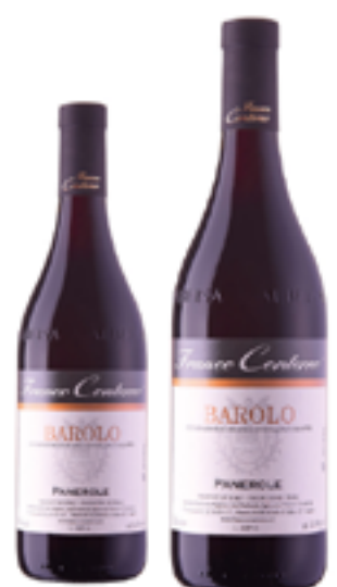
BAROLO DOCG PANEROLE 100% Nebbiolo DISP. 1,5 L, 3 L E 5 L