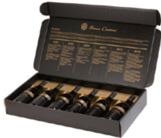
BAROLO RISERVA DOCG BUSSIA VERTICALE 6 ANNATE