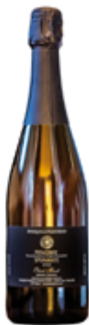
SPUMANTE PIEMONTE ALTA LANGA METODO CLASSICO DOCG 70% Pinot Nero - 30% Chardonnay