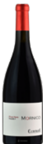
MORNICO VINO ROSSO RISERVA DOP 100% Pinot Nero