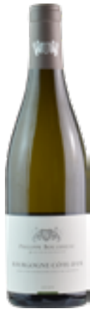
BOURGOGNE COTE D'OR 100% Chardonnay