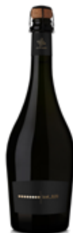
LEVEL 820 SPUMANTE BIO VEGANO METODO CLASSICO DOSAGGIO ZERO 100% Chardonnay