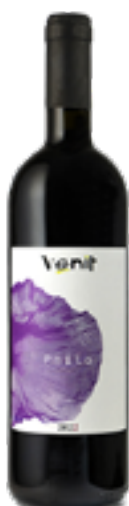
PHILO VENEZIA GIULIA ROSSO IGT 100% Merlot