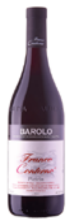
BAROLO DOCG PIETRIN 100% Nebbiolo