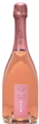
PROSECCO ROSÉ DOC MILLESIMATO EXTRA DRY METODO CHARMAT Glera, Pinot Nero