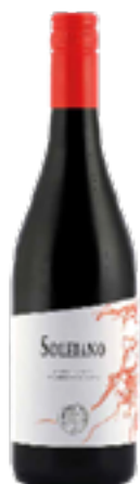
MARCHE ROSSO IGT SOLEIANO 70% Sangiovese, 30% Merlot