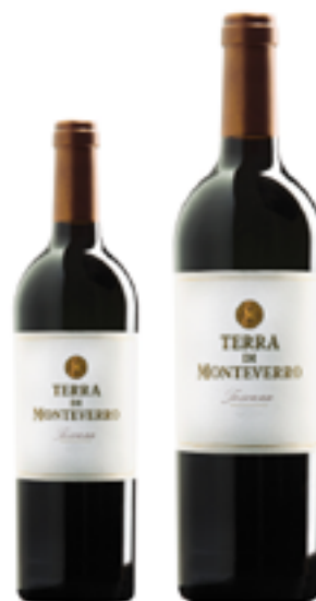
TOSCANA ROSSO IGT TERRA DI MONTEVERRO 50% C.Sauv. - 30% C.Franc - 15% Merlot - 5% P. Verdot DISP. 0,375 L, 1,5 L