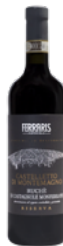
CASTELLETTO DI MONTEMAGNO RISERVA 100% Ruchè