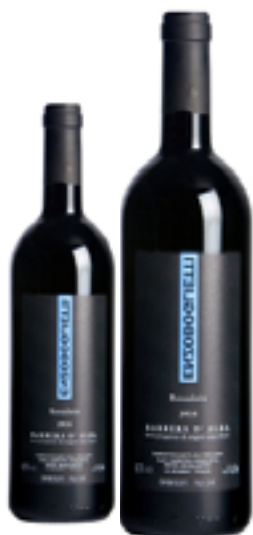
BARBERA D'ALBA DOC ROSCALETO 100% Barbera DISP. 1,5 L