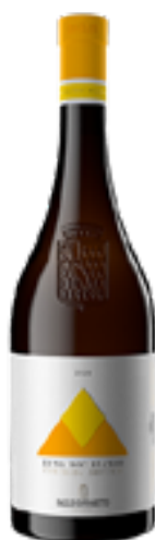
ETNA BIANCO DOC BIO CONTRADA ARCURIA 100% Carricante