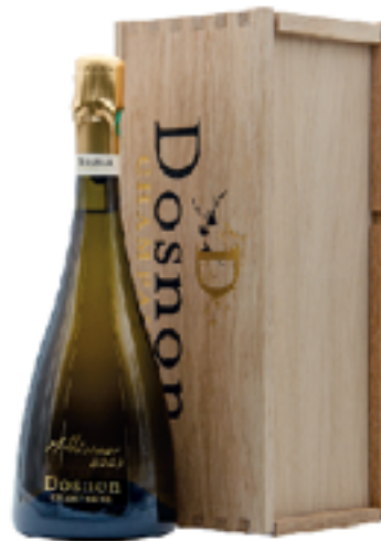
MILLESIMATO 60% Pinot Noir - 40% Chardonnay