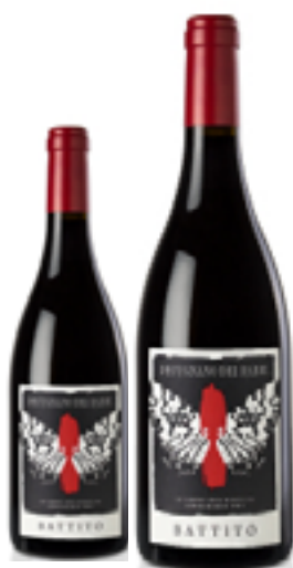
UMBRIA ROSSO IGT BATTITO 33% Sangiovese - 33% Merlot 34% Cabernet Sauvignon DISP. 1,5 L