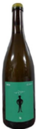
IDEA BIANCO Viognier, Chardonnay, Pinot Grigio, Riesling