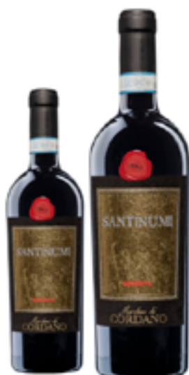
MONTEPULCIANO D'ABRUZZO RISERVA DOC SANTINUMI 100% Montepulciano DISP. 1,5 L, 3L