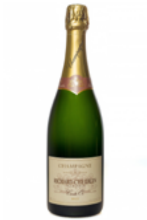
BRUT CARTE D'OR 70% Pinot Noir - 30% Chardonnay