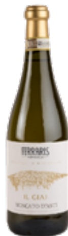
MOSCATO D'ASTI DOCG IL GIAJ 100% Moscato