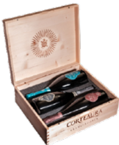
CASSETTA LEGNO "I MILLESIMI DI CORTEAURA" RARAMÈ'-BLAU-SATEN MILL. 2018