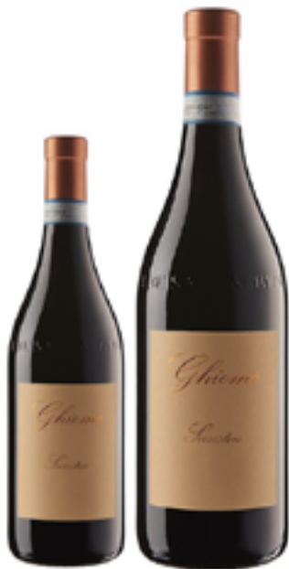
NEBBIOLO D'ALBA SUPERIORE DOC SANSTEU 100% Nebbiolo DISP. 1,5 L