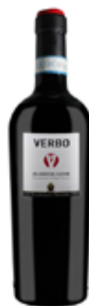
AGLIANICO DEL VULTURE DOP VERBO 100% Aglianico