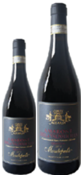
AMARONE DELLA VALPOLICELLA CLASSICO DOCG 80% Corvina-10% Corvinone-10% Rondinella DISP. 1,5 L