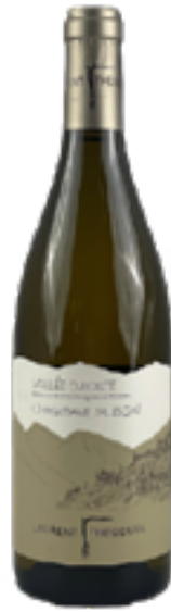
CHAMBAVE MUSCAT DOC 100% Moscato Giallo