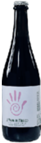
MARGHERITA IGT RABOSO VENETO 100% Raboso Veronese