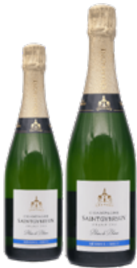
GRAN CRU RÉSERVE BRUT 100% Chardonnay DISP. 1,5 L, 3 L