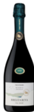
SPUMANTE METODO CLASSICO TRENTO DOC "BREZZA RISERVA "PAS DOSE" 100% Chardonnay