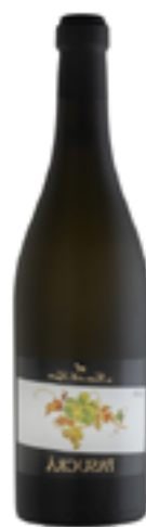
MOSCATO SECCO DOC PASUCRA' 750 CL 100% Brachetto