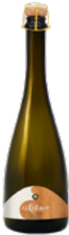
BRUT NATURE MET ANCESTRALE ALCHEMIA 100% Grechetto