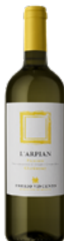
PIEMONTE CHARDONNAY ARPIAN 100% Chardonnay