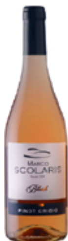
PINOT GRIGIO FRIULI DOC "BLUSH" 100% Pinot Grigio