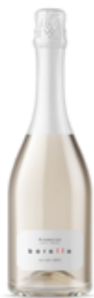
PROSECCO TREVISO MILLESIMATO DOC 100% Glera