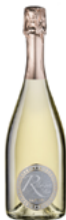
SPUMANTE BRUT RIBONA COLLI MACERATESI DOC "METODO MARTINOTTI" 100% Ribona