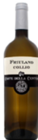
FRIULANO COLLIO DOC 100% Friulano