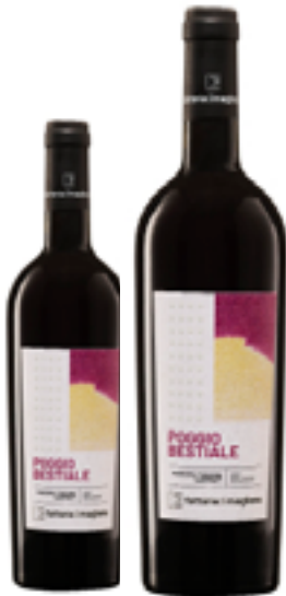
MAREMMA TOSCANA DOC BIO POGGIO BESTIALE 40% Cab. Sauv. - 30% Cabernet Franc 25% Merlot - 5% P. Verdot DISP. 0.375 L, 1.5 L, 3 L, 5 L, 9 L, 12 L