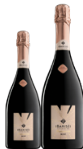
FRANCIACORTA DOCG ROSE' CUVÉE MILLESIMATA BRUT 100% Pinot Nero (80% vinificato In bianco, 20% criomacerazione) DISP. 1,5 L E 3 L