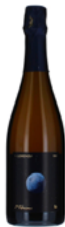
EXTRA BRUT MILLESIMATO A LORENZO 100% Pinot Nero