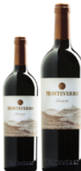
TOSCANA ROSSO IGT MONTEVERRO 35% Cab. Sauv., - 35% Cab. Franc 25% Merlot - 5% P. Verdot DISP. 0,375 L, 1,5 L, 3 L, 6 L, 9 L