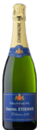
BRUT MILLESIME PREMIER CRU 50% Pinot Noir - 50% Chardonnay