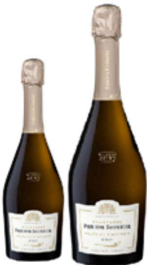
BRUT VINTAGE MILLESIME 100% Pinot Noir DISP: 1,5 L, 3 L