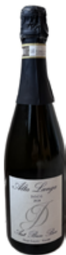
ALTA LANGA DOCG AUT BUN BEN 100% Chardonnay

Ama le cose ben fatte e ama far star bene le persone, con il suo lavoro e dedizione riesce a trasmettere l'eccellenza qualitativa dei suoi prodotti e del territorio della Langa Astigiana.