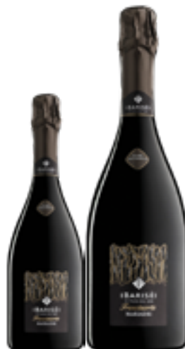
FRANCIACORTA DOCG MARIADRI CUVÉE MILLESIMATA EXTRABRUT 100% Chardonnay DISP. 1,5 L