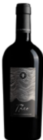
VERMENTINO DI SARDEGNA DOC "THEO" 100% Vermentino