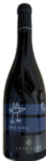
VINO ROSSO BIO (100 % PIWI) SINUS RORIS 100% Vitigni Piwi