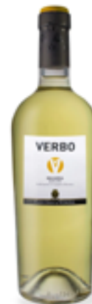
MALVASIA BASILICATA IGP VERBO 100% Malvasia di Basilicata