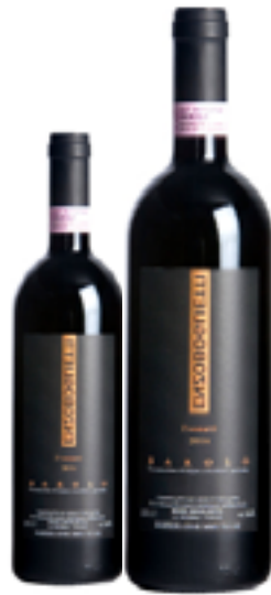
BAROLO DOCG FOSSATI 100% Nebbiolo DISP. 1,5 L E 3 L