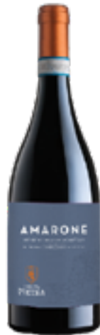
AMARONE DELLA VALPOLICELLA DOCG 70% Corvina Ver - 25% Rondinella 5% Corvinone