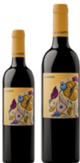
COLLEZIONE PUARTE EUFEM RIBOLLA GIALLA IGT 100% Ribolla Gialla DISP 1,5 L