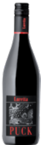
VINO ROSSO D'ITALIA PUCK 100% Pinot Nero