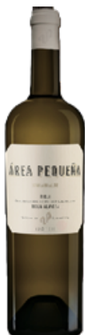
MAKARRALDE VINO BIANCO AREA PEQUENA 100% Viura