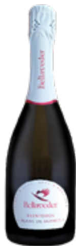
TRENTO DOC BLANC DE BLANCS 100% Chardonnay