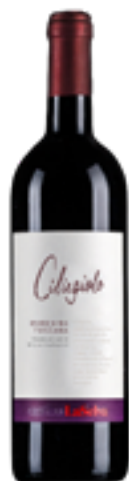
CIGLIEGIOLO SATUS DOC MAREMMA TOSCANA BIO 100% Ciglioglio