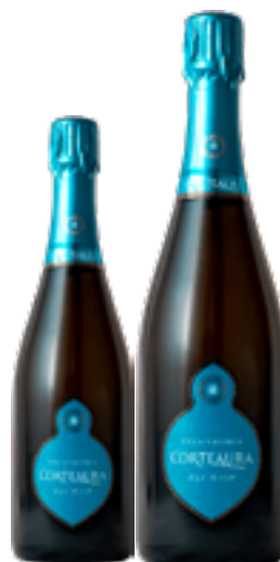
FRANCIACORTA DOCG PAS DOSÈ 80% Chardonnay - 20% Pinot Nero DISP. 1,5 L