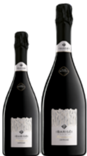
OPPOSE' CUVÉE MILLESIMATA BLANC DE NOIR EXTRA BRUT 100% Pinot Nero DISP. 1,5 L