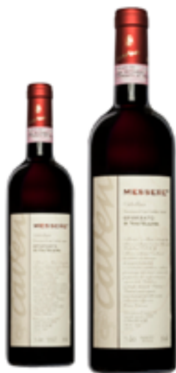
SFORZATO DI VALTELLINA DOCG MESSERE 100% Nebbiolo DISP. 1,5 L E 3 L