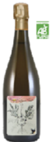
LE VILLAGE MILLESIME 100% Chardonnay