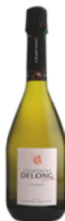
GRAND RÉSERVE 50% Chardonnay - 30% Pinot Noir 20% Pinot Meunier