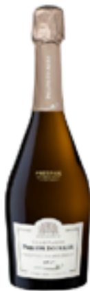
BRUT PRESTIGE 100% Chardonnay DISP. 1,5 L