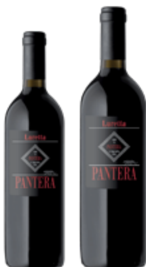
VINO ROSSO D'ITALIA PANTERA Barbera, Croatina, Cabernet Sauvignon DISP. 1,5 L, 3 L, 6 L, 9 L, 12 L, 15 L