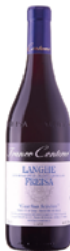
LANGHE FREISA DOC 100% Freisa