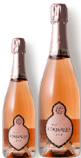
FRANCIACORTA DOCG ROSÈ 75% Chardonnay - 25% Pinot Nero DISP. 1,5 L