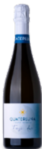
FRANCIACORTA EXTRA BRUT DOCG "FASE 2" 65% Pinot Nero, 35% Chardonnay