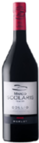
MERLOT COLLIO DOC 100% Merlot