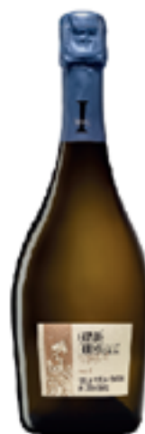
CHAPITRE 5 BLANC DE BLANCS MILLÉSIMÉ 100% Chardonnay