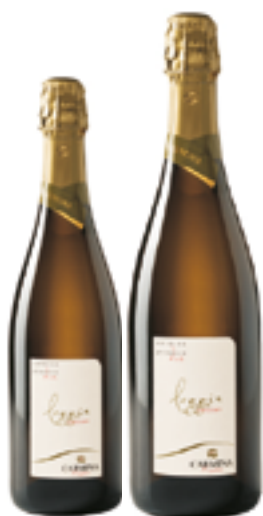
PROSECCO EXTRA DRY DOC LA LOGGIA 100% Glera DISP. 1,5 L

L'amore per il proprio territorio e la ricerca di tecnologie sempre nuove accompagnano la famiglia Sacchetto da ormai tre generazioni. Tradizione e tecnologia convivono in Carmina, creando un'azienda innovativa ma attenta ai saperi che si tramandano da generazioni. Tecnologie avanzate, attenzione al territorio, cura di ogni pianta, vendemmia manuale e concimi naturali sono alcuni degli elementi che donano ai vini quell'equilibrio naturale che li distingue. L'azienda vitivinicola Carmina è circondata da circa 15 ettari di vigneto posto sulle colline a nord est di Conegliano, dove da sempre la vite offre il meglio di sé e dove in particolare il Prosecco ha trovato la sua dimora naturale.