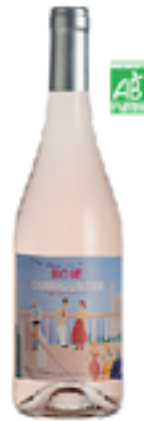
GUINGUETTE ROSÉ Syrah, Grenache, Cinsault