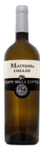
MALVASIA COLLIO DOC 100% Malvasia