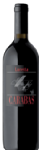
BARBERA COLLI PIACENTINI DOC CARABAS 100% Barbera DISP. 1,5 L