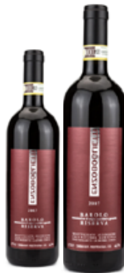
BAROLO RISERVA DOCG 100% Nebbiolo DISP. 1,5 L E 3 L