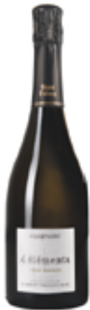
BRUT MILLÈSIME 4 ÉLÉMENTS - PINOT NOIR 100% Pinot Noir