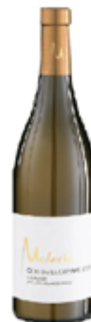
SAUMUR CLOS DE LA CERISAIE 100% Chenint Blanc