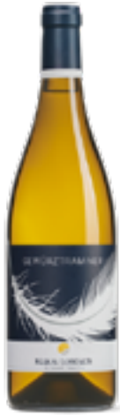
GEWÜRZTRAMINER SÜDTIROL / ALTO ADIGE DOC 100% Gewürztraminer