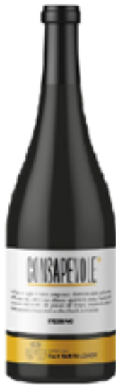
VINO BIANCO CONSAPEVOLE 100% Trebbiano