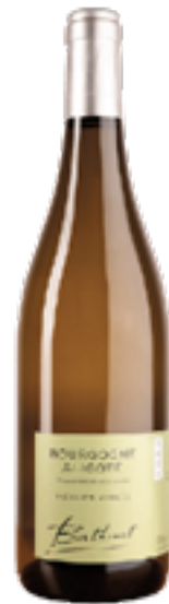
BOURGOGNE ALIGOTÉ VIEILLES VIGNES 100% Aligoté