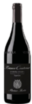
BARBERA D'ALBA SUPERIORE DOC BRICCO TORTA 100% Barbera