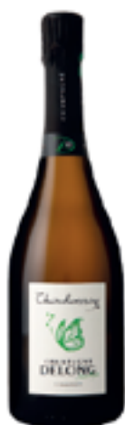
ESPRIT NATURE CHARDONNAY 100% Chardonnay