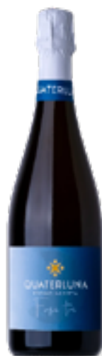
FRANCIACORTA EXTRA BRUT DOCG "FASE 3" 65% Chardonnay (di cui 8 % Barrique), 35% Pinot Noir