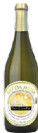
MOSTO D'UVA PARZIALMENTE FERMENTATO BIANCO RAP DE MESSA