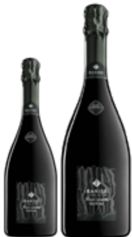
FRANCIACORTA DOCG NATURA CUVÉE MILLESIMATA DOSAGGIO ZERO 80% Chardonnay, 20% Pinot Noir DISP. 1,5 L E 3 L