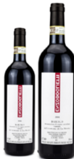
BAROLO DOCG DEL COMUNE DI LA MORRA 100% Nebbiolo DISP. 1,5 L