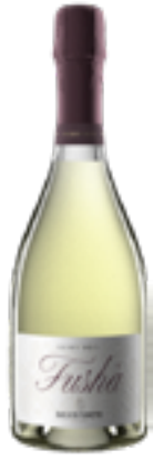
SPUMANTE EXTRA BRUT TERRE SICILIANE IGT BIO FUSHA Uve Bianche Siciliane