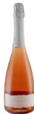
LINEA SPUMANTE SPUMANTE PERRICONE ROSATO BRUT TERRE SICILIANE IGP 100% Perricone