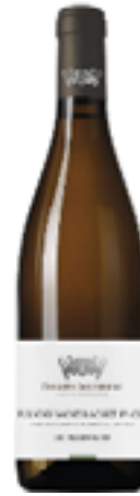
PULIGNY MONTRACHET PREMIER CRU LES CHAMPS GAINS 100% Chardonnay