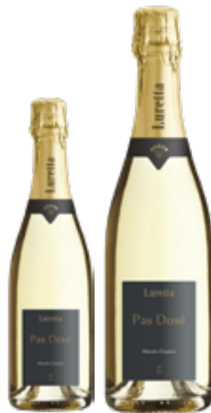
METODO CLASSICO VSQ PAS DOSE' Pinot Nero, Chardonnay DISP. 1,5 L