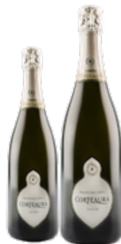
FRANCIACORTA DOCG SATEN 100% Chardonnay DISP. 1,5 L