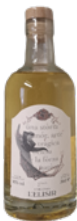
"IL SALTO DEGLI SPOSI" ELISIR VINO AROMATIZZATO DA UVE MANZONI BIANCO