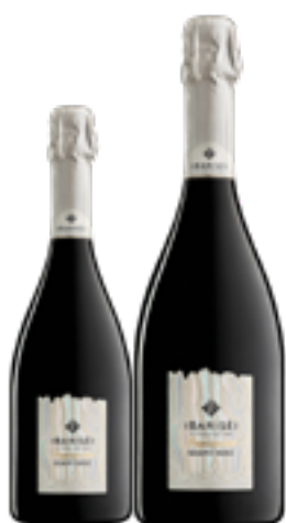
FRANCIACORTA DOCG CUVÉE BRUT "SEMPITERRE" 90% Chardonnay, 10% Pinot Noir DISP. 1,5 L E 3 L

Le vigne de I Barisèi vengono curate nel rispetto dell'equilibrio ambientale da molto prima che la sensibilità verso la sostenibilità e l'agricoltura biologica diventasse d'attualità. Chi lavora in vigna sente di essere parte di qualcosa di grande: la terra è un elemento vivo e prezioso, da accudire senza forzature.