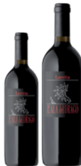
GUTTURNIO DOC ALA DEL DRAGO Barbera, Coatina DISP. 1.5 L