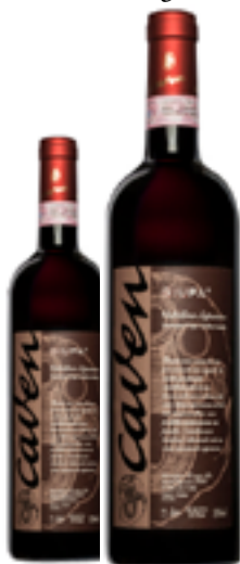
VALTELLINA SUP RIS DOCG GIUPA 100% Nebbiolo DISP. 1,5 L