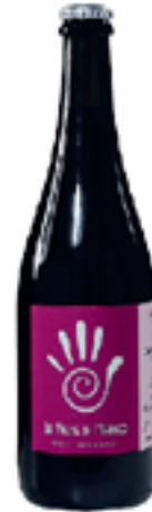
EL MORJA IGT CARMENERE VENETO 100% Carmenere