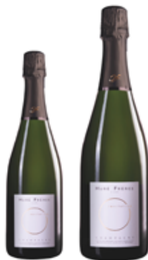
INVITATION RÉSERVE BRUT 15% Chardonnay - 35% Pinot Noir 50% Pinot Meunier DISP. 1,5 L

La coltivazione avviene nel pieno rispetto della terra e dell'ambiente circostante al fine di elaborare degli champagnes ricchi, complessi ed eleganti che riflettono interamente l'autenticità del frutto della vigna.