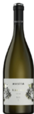
KARIMA GRILLO SICILIA DOC LINEA MORI 100% Grillo

Nella seconda metà dell'800 Don Ignazio piantò il primo vigneto, certo che quella zona ai pendii del colle che gli arabi chiamarono 'musità' fosse tra le più vocate della Sicilia occidentale. Storia e innovazione si fondono su sessanta ettari di vigneto di proprietà della famiglia Ardagna, tra i territori collinari di Salemi ad una altitudine che va dai 400 a più di 600 metri. Come un giardino coltivato per le generazioni future, l'azienda sorge e prospera nel nome della sostenibilità. Ogni giorno tutti i reparti aziendali operano tessendo il filo della responsabilità ambientale e sociale.