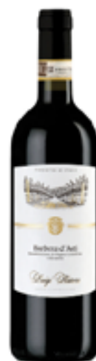
BARBERA D'ASTI DOCG LUIGI RASORE 100% Cortese