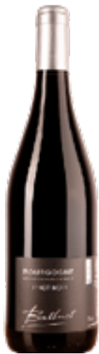
BOURGOGNE PINOT NOIR 100% Pinot Noir