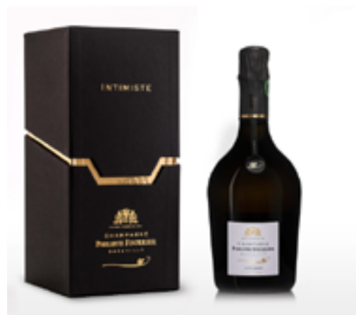
GRAN CUVÉE INTIMISTE VINTAGE 100% Chardonnay