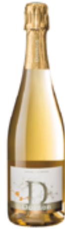
BLANC DE BLANCS BRUT RÉCOLTE BLANCHE 100% Chardonnay