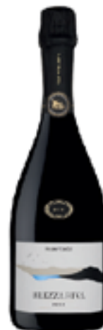
SPUMANTE METODO CLASSICO TRENTO DOC "BREZZA RIVA MILLESIMATO" 100% Chardonnay